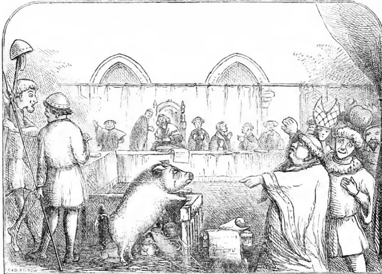
Illustration from Chambers Book of Days depicting a sow and her piglets being tried for the murder of a child. The trial allegedly took place in 1457, the mother being found guilty and the piglets acquitted. ( https://en.wikipedia.org/wiki/Animal_trial )