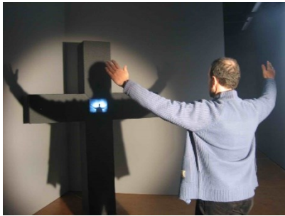
Peter Weibel: Ukřižování reality, 1973