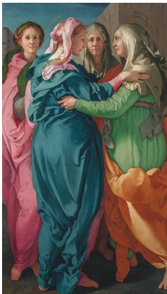
Bill Viola: The Greeting 1995 (Visitazione 1528 – Carmignano di Pontormo)