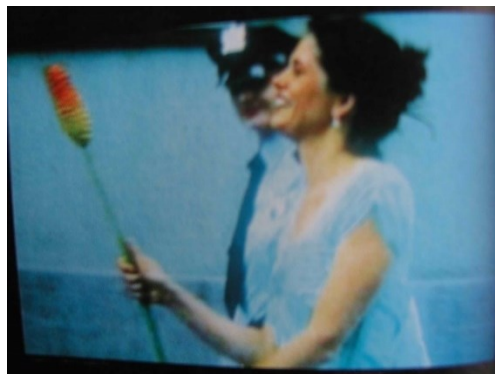
Pipilotti Rist: Ever is Over All, 1997