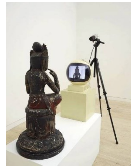
Nam Jun Paik: TV Buddha 1976