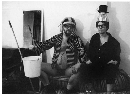
Steina + Woody Vasulka / Kitchen