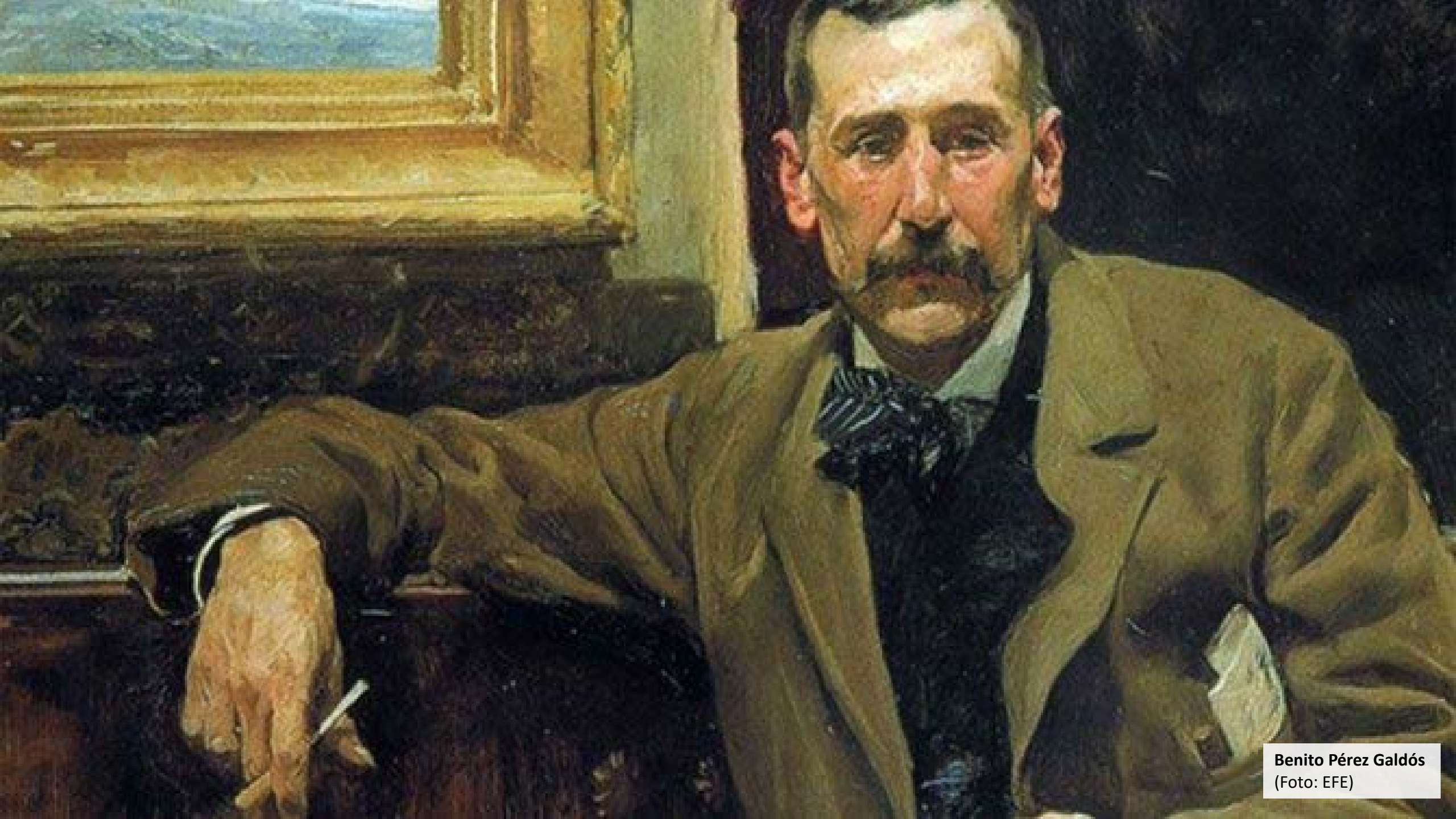
Benito Pérez Galdós