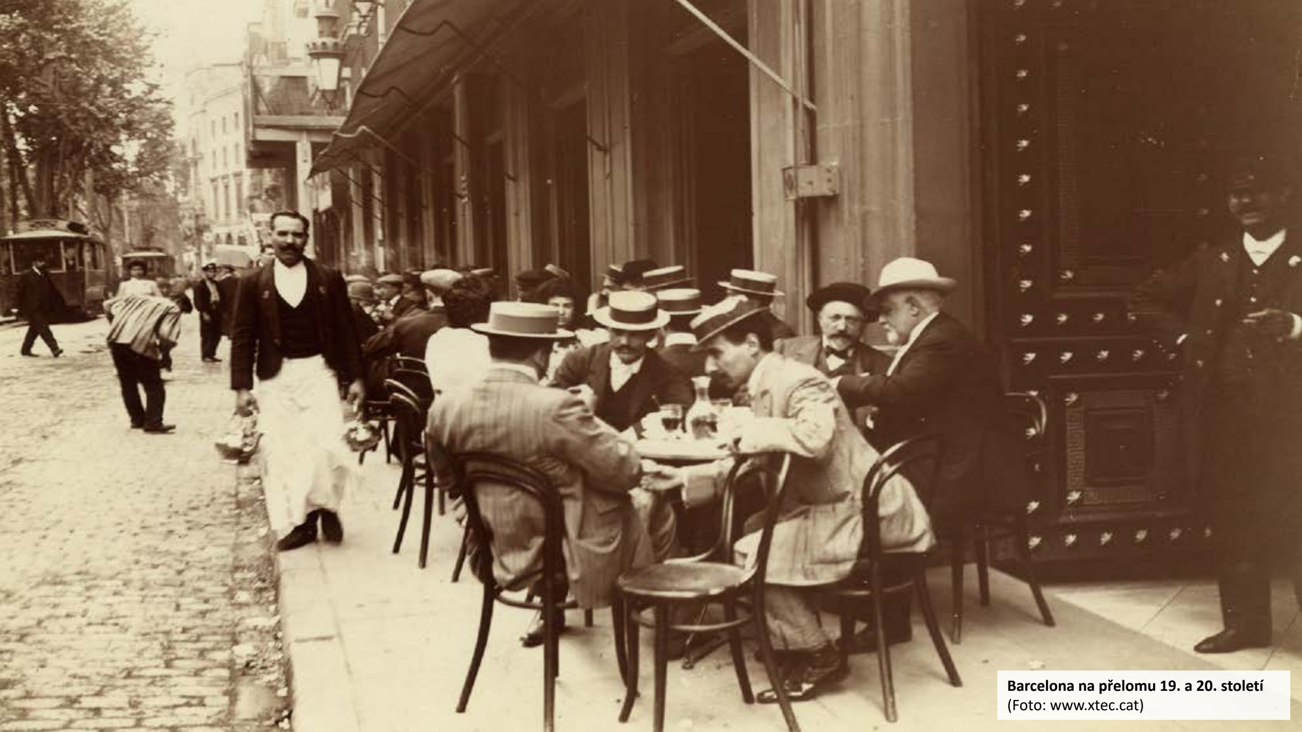
Barcelona na přelomu 19. a 20. století