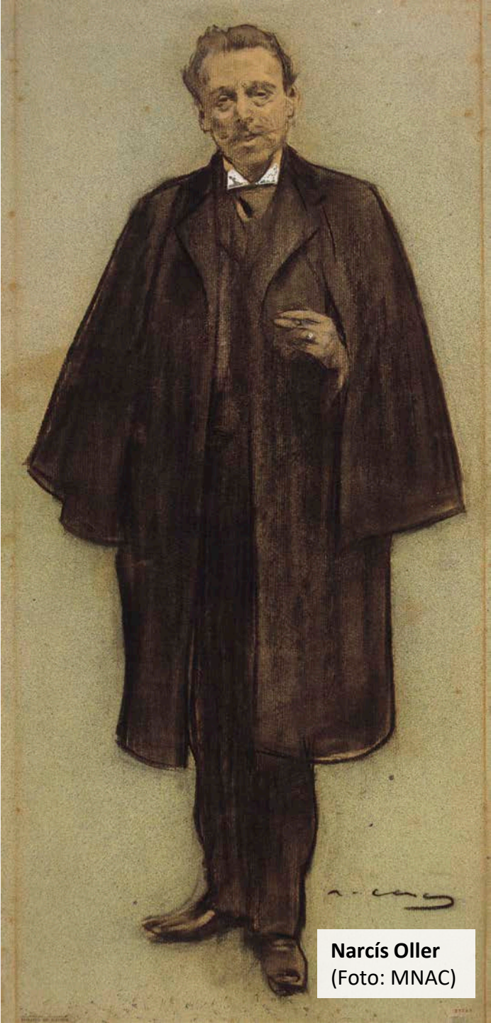
Narcís Oller