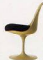
Eero Saarinen 1956, 1957