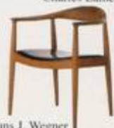
Hans J. Wegner 1949