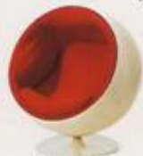
Eero Arnio 1965