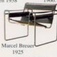
Marcel Breuer 1925