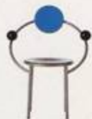
Michele De Lucchi 1983