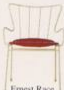
Ernest Race 1950