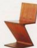
Gerrit Rietvelt 1934