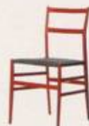
Gio Ponti 1956