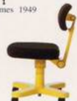
Ettore Sottsass Junior 1972