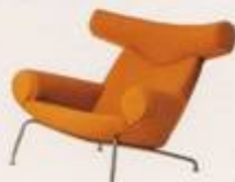
Hans J. Wegner 1961