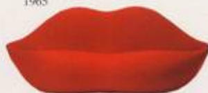
Studio 65 1970