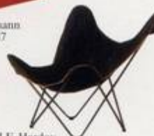
J.F. Hardoy, A. Bonet & J. Kurchen 1938