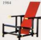
Gerrit Rietvelt 1917, 1918