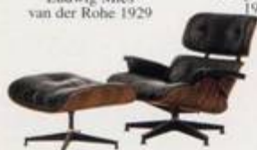
Charles Eames 1956