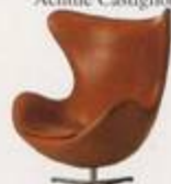
Arne Jacobsen 1958