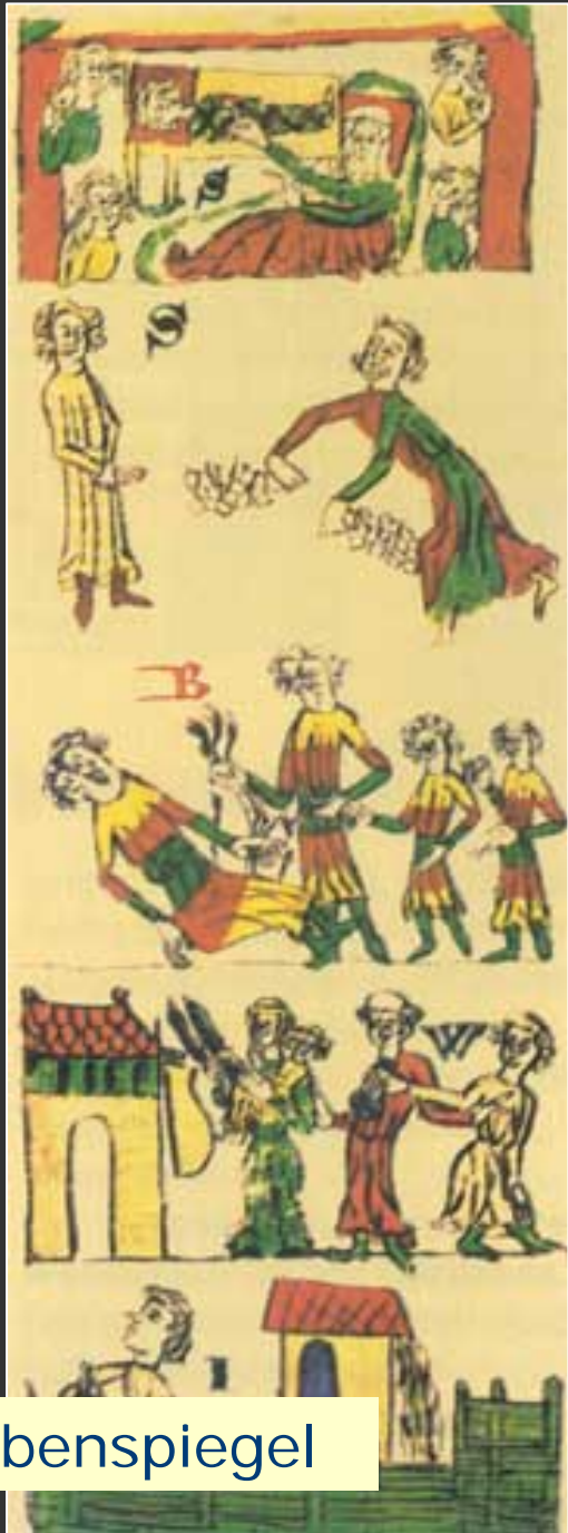
Sachsenspiegel a Schwabenspiegel

W ei swert her got in er- richte zu beschirmen dē cristenheit dem pabste das geistliche dem heiser das werklidige. D em pabste iz gesa- ces zu richte in beschirmen er uf dē nem blandin pherde vnce der he- ser sal yu den regerent halbin das der sari nicht wunke. D is iz bedu- was dem pabste widir sit das he- nur geistlichen gerichte nicht berwin- gen mac. D as iz der heiser mit wer- lichen rechte ninge de pabste geschick zu sine so sal in geistliche gewalt heise dem werklidige gerichte ab iz bedarf. I n idich cristen man iz phliche wren suchene dries in dem ier- fine he zu sine cristen lomen is in dem liden da he tunc gesefin is. V erheit iz abir arthant. S chepman lunt in dē beschide sein suchin dū. P hliche ist d rumpenbude lant sein der cristenere zu glair wis sū si werlich gerichte sūche. I n schepman des greten dng ober achten wochin vñder küniges lant. E - ger man abir ein dng ve vunde vnderid iz vda deme ehtin dng vñder vñderid das sū si suchin in phliche durch das ve gerichte gerichte werde. I n nure hadu si vor wigin iz ege. H er iz richte dar iz lo nungis vō im ledic iz. I n phliche für auch phliche des schepman duncy