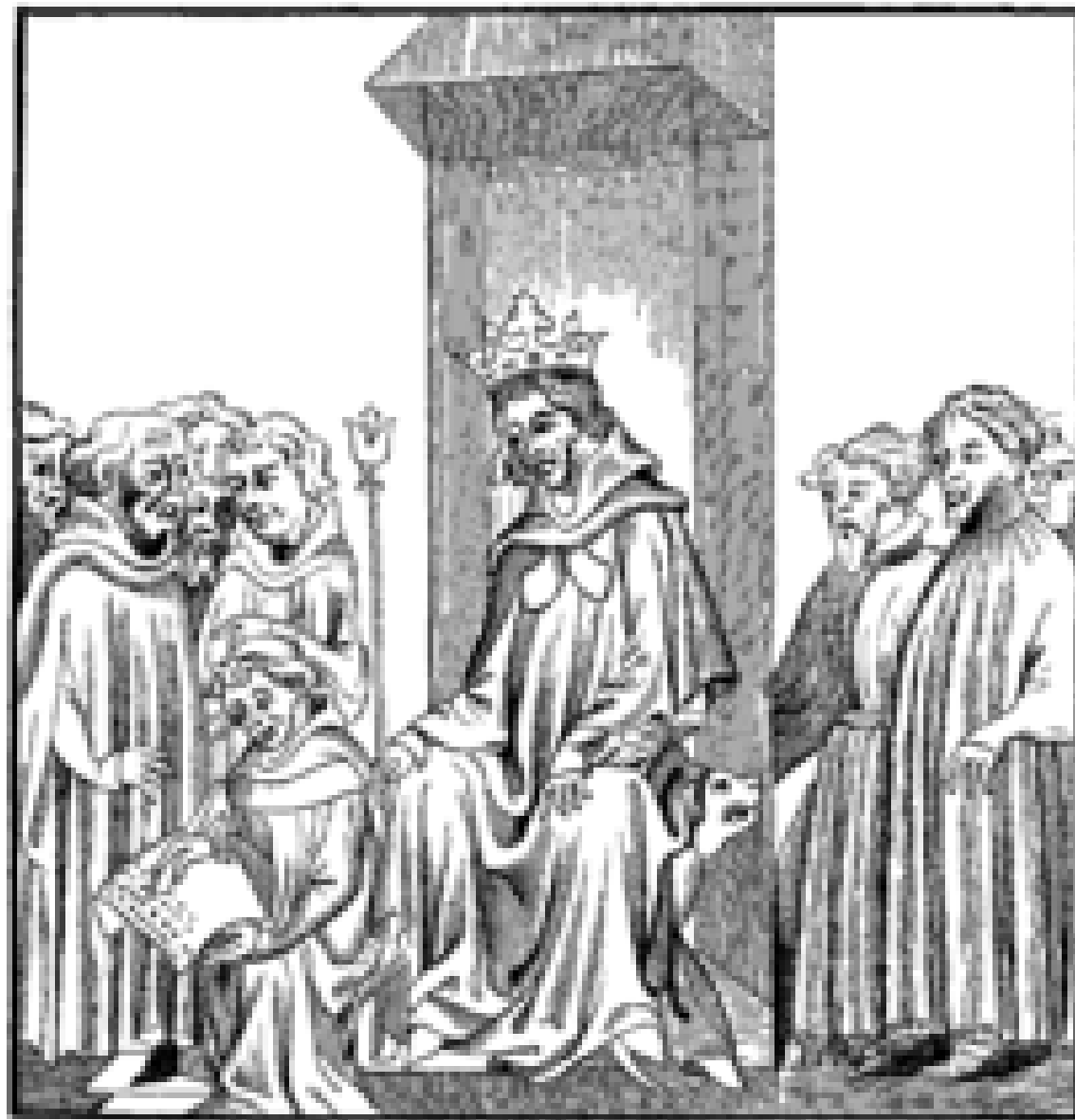
Fig. 1.—The King of the Franks, in the midst of the Military Chiefs who formed his Trouve , or armed Court, dictates the Salic Law (Code of the Barbaric Laws).—Fac-simile of a Miniature in the "Chronicles of St. Denis," a Manuscript of the Fourteenth Century (Library of the Arsenal).