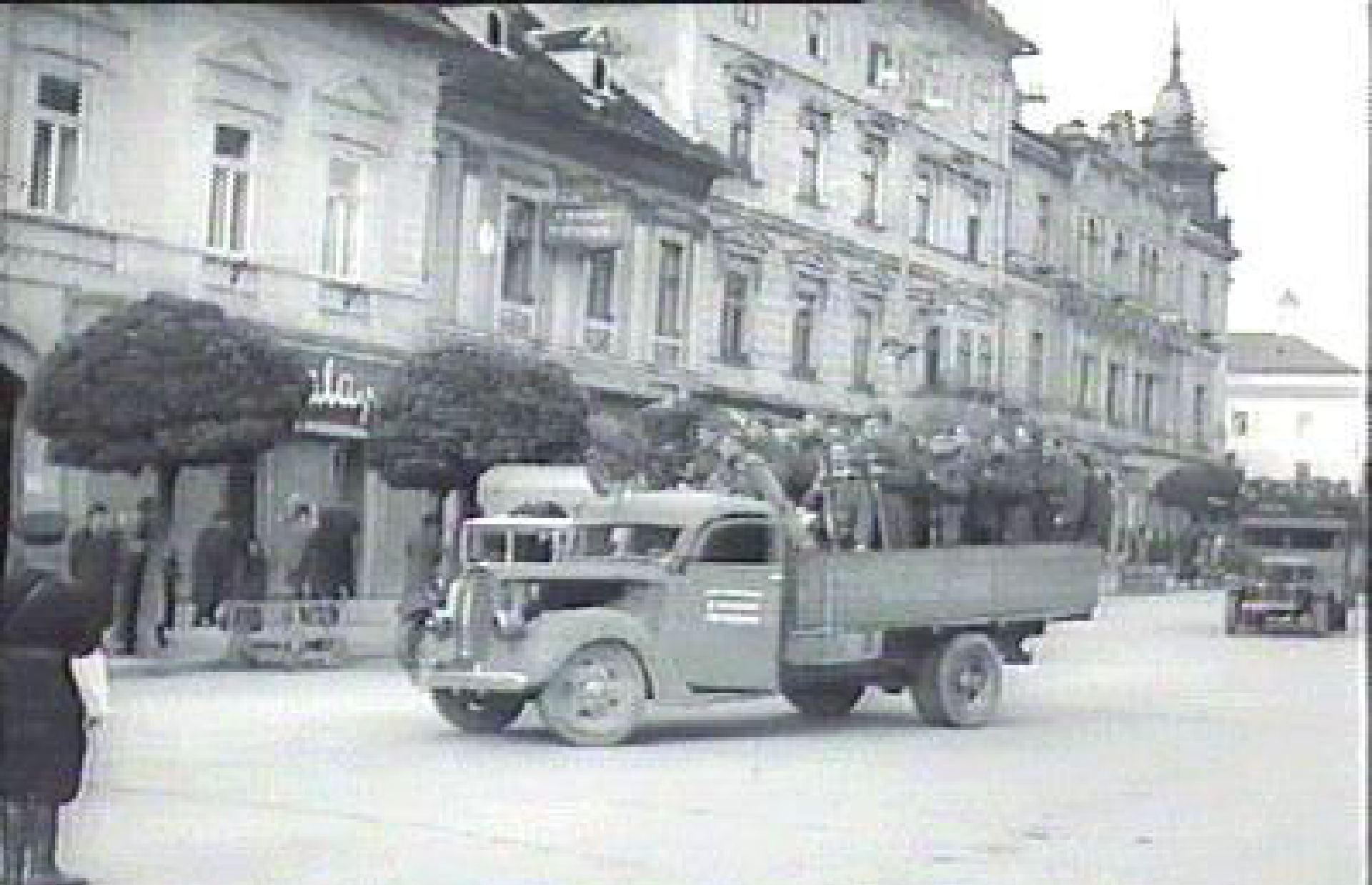
Banská Bystrica za SNP