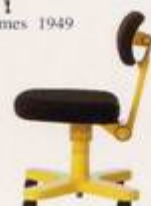
Ettore Sottsass Junior 1972