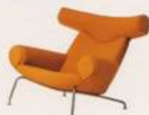
Hans J. Wegner 1961