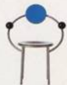
Michele De Lucchi 1983