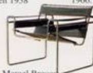
Marcel Breuer 1925