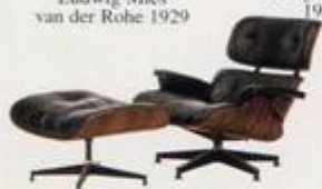
Charles Eames 1956