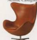
Arne Jacobsen 1958