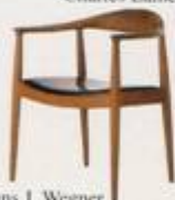
Hans J. Wegner 1949