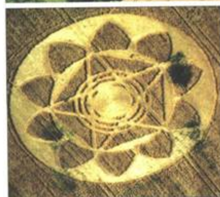
„Bythornský zázrak“, poslední a nejpůsobivější piktogram roku 1993