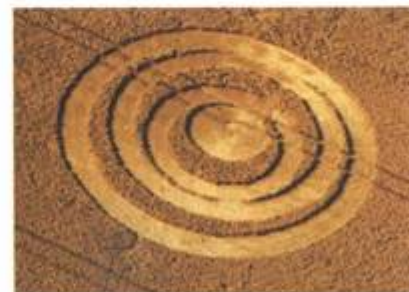
Srpky měsíce v Danebury, Hampshire. 2. srpen 1998. Průměr cca 75 stop (23 m).