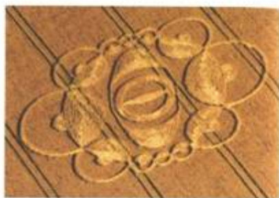
„Broach 2“ (Brož 2). Windmill Hill, Butser, Hampshire. 10. červenec 1998. Průměr cca 200 stop (61 m). Složitá čtyřúhelníková formace. Ječmen.