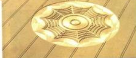
Poslední piktogram roku 1994: obrovská pavučina, jež se objevila 15. srpna těsně vedle pravěkého kamenného kruhu v Avebury