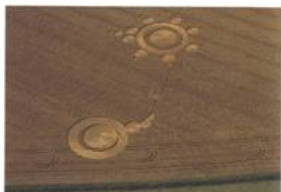
„Thought Bubble and Broach“ (Myšlenková bublina a brož). Danebury, Hampshire. 2. srpen 1998. Průměr cca 60 stop (18 m). Pšenice.