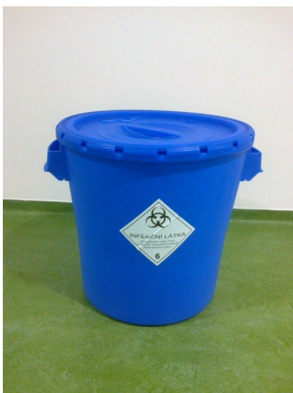
Obrázek 3 Odpadní nádoba do laboratoře určená na ostré předměty