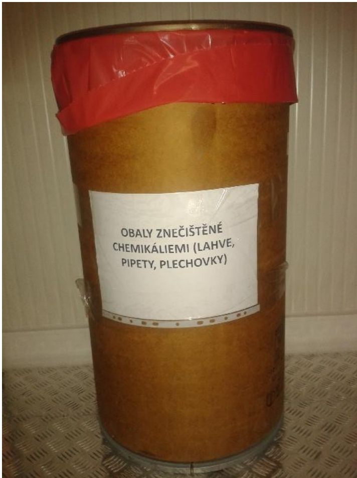
Obrázek 2 Kontejner na obaly znečištěné chemikáliemi, ostré předměty, pipety