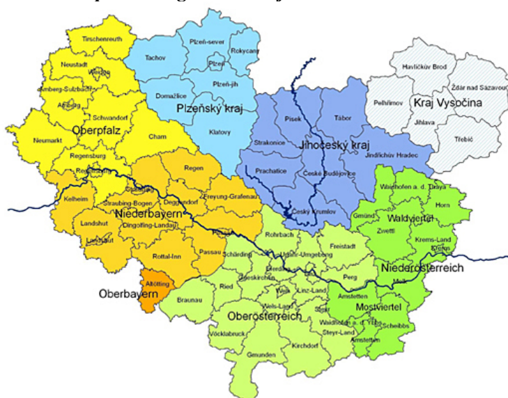
Obr. 1: Územní vymezení Evropského regionu Dunaj-Vltava

Evropský region Dunaj-Vltava se rozprostírá na území třech členských států Evropské unie (viz obrázek 1): Česká republika (Plzeňský kraj, Jihočeský kraj, Kraj Vysočina), Spolková republika Německo (Horní Falc, Dolní Bavorsko a okres Altötting z Horního Bavorska) a Republika Rakousko (Horní Rakousko, okresy Wald- a Mostviertel z Dolního Rakouska).