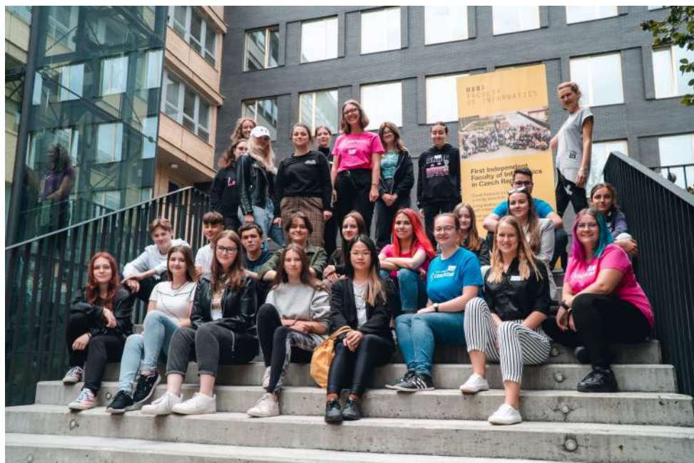
Letní škola IT pořádaná Czechitas ve spolupráci s FI MU