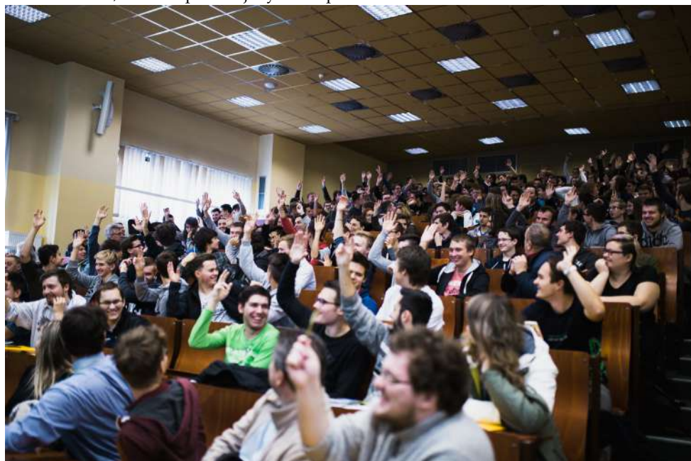
Dny otevřených dveří (více na straně 9)