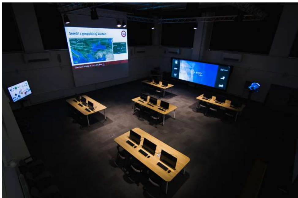
Učebna KYPO, ve které probíhají kyberbezpečnostní cvičení