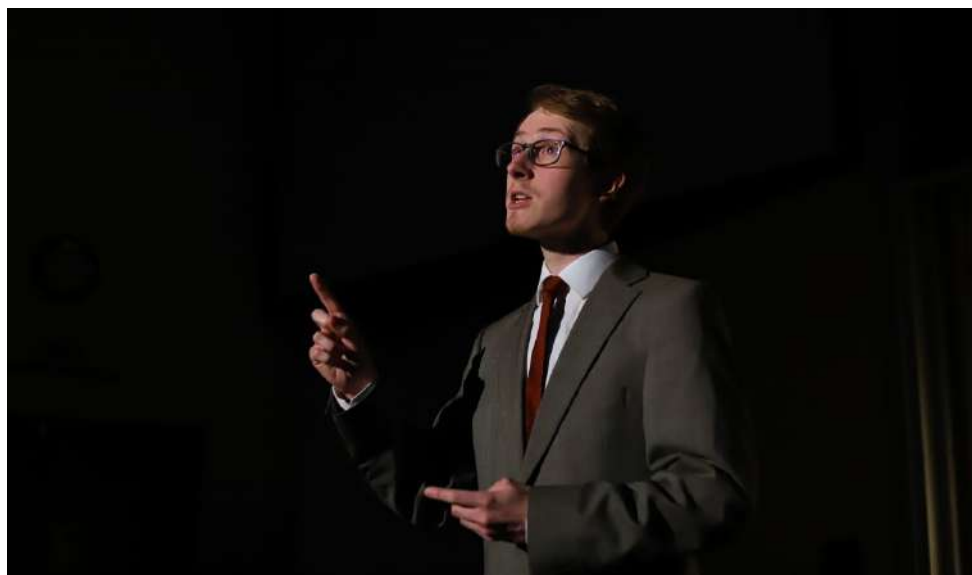
Premiéra hry Alan Turing (2022) studentského ProFIdivadla