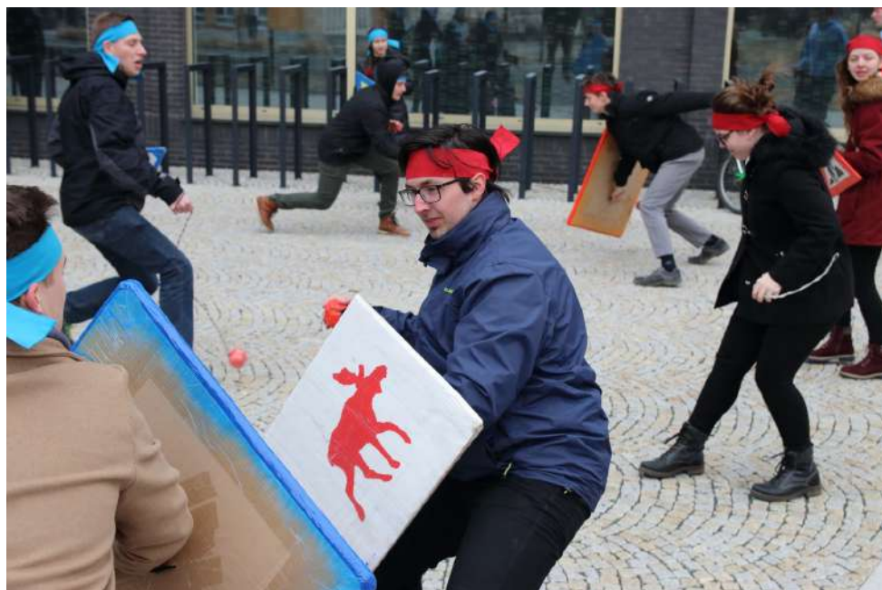
Fotografie z akce Poznej FI