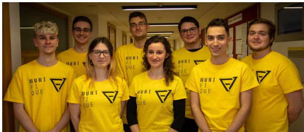
Studentští průvodci pro dny otevřených dveří