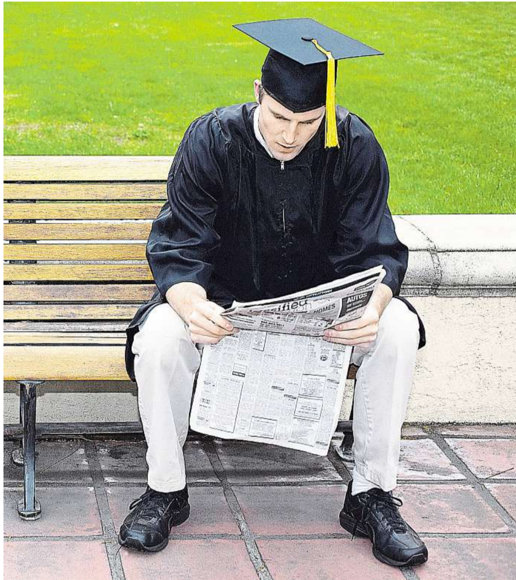
Čerstvý diplom a vysoký plat. Najít odpovídající zaměstnání je v některých oborech hračka.

Sledováno bylo na 35 000 absolventů v období prvních pěti let po ukončení školy, a to z několika hledisek: jestli našli zaměstná-