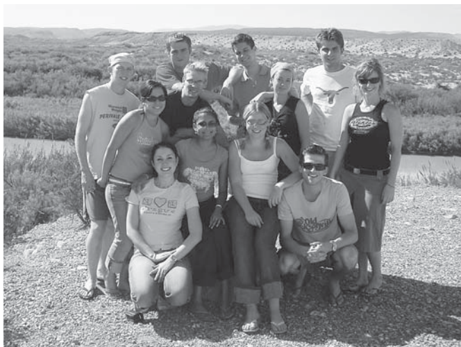
V národním parku Big Ben – za řekou je již Mexiko

Na druhé straně studenti se také činí. V hodinách se zajímají, ptají se a hovoří i mezi sebou. Získávají znalosti a dovednosti využitelné v budoucnu – předměty jsou plně praktických po-