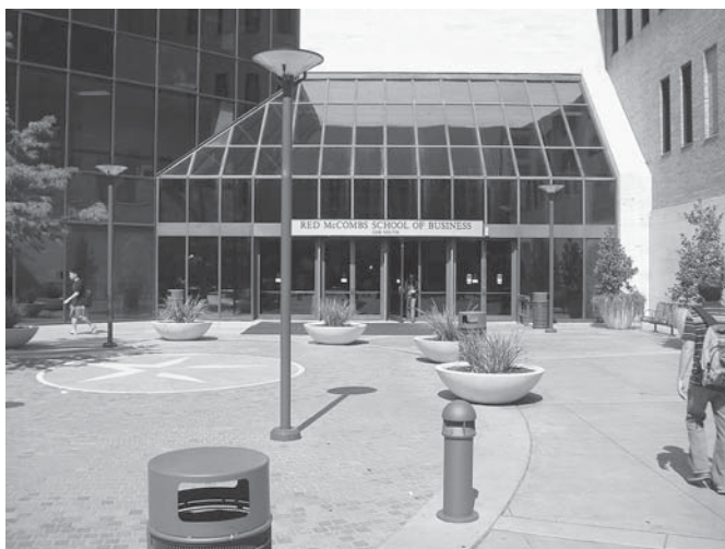
Hlavní vstup do Red McCombs School of Business

baru. Tzv. „fake ID“ jsou běžné, ale v barech se pohybují strážci zákona „under cover“, takže jednomu italskému kamarádovi se stala nepříjemná příhoda – hovořil hlasitě o svém věku a byl na noc zatčen.