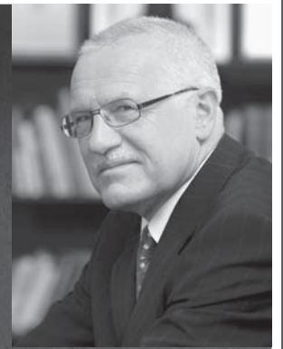
Václav Klaus na VŠE (str. 5)