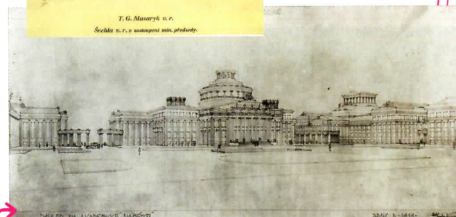
Takhle mohl vypadat kampus Masarykovy univerzity. Aspoň podle jedné z vizí z dob první republiky.