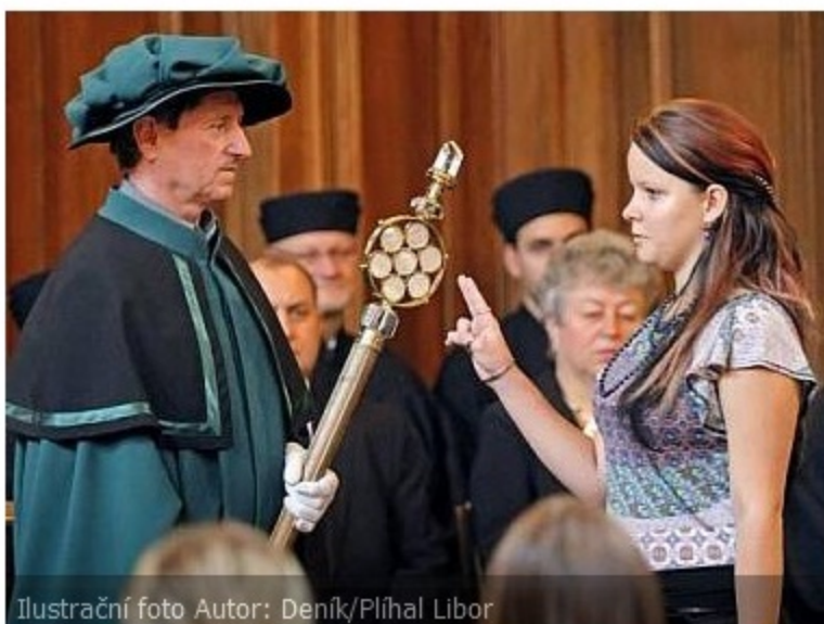
Ilustrační foto Autor: Deník/Plíhal Libor