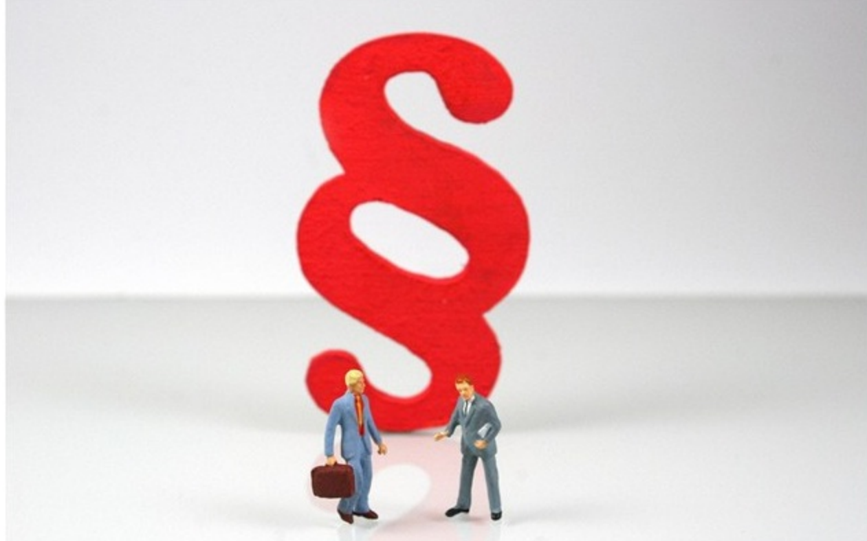
Justice, právo, spravedlnost, zákon, paragraf, stihání

Projekt Hromadněžaloby.cz umožňuje napáleným spotřebitelům ušetřit za právníka. Přítrž falešným vysokoškolským diplomům by mohl učinit web Pravydiplom.cz. A odebrat potraviny přímo od farmáře lze na Českébiopotraviny.cz.