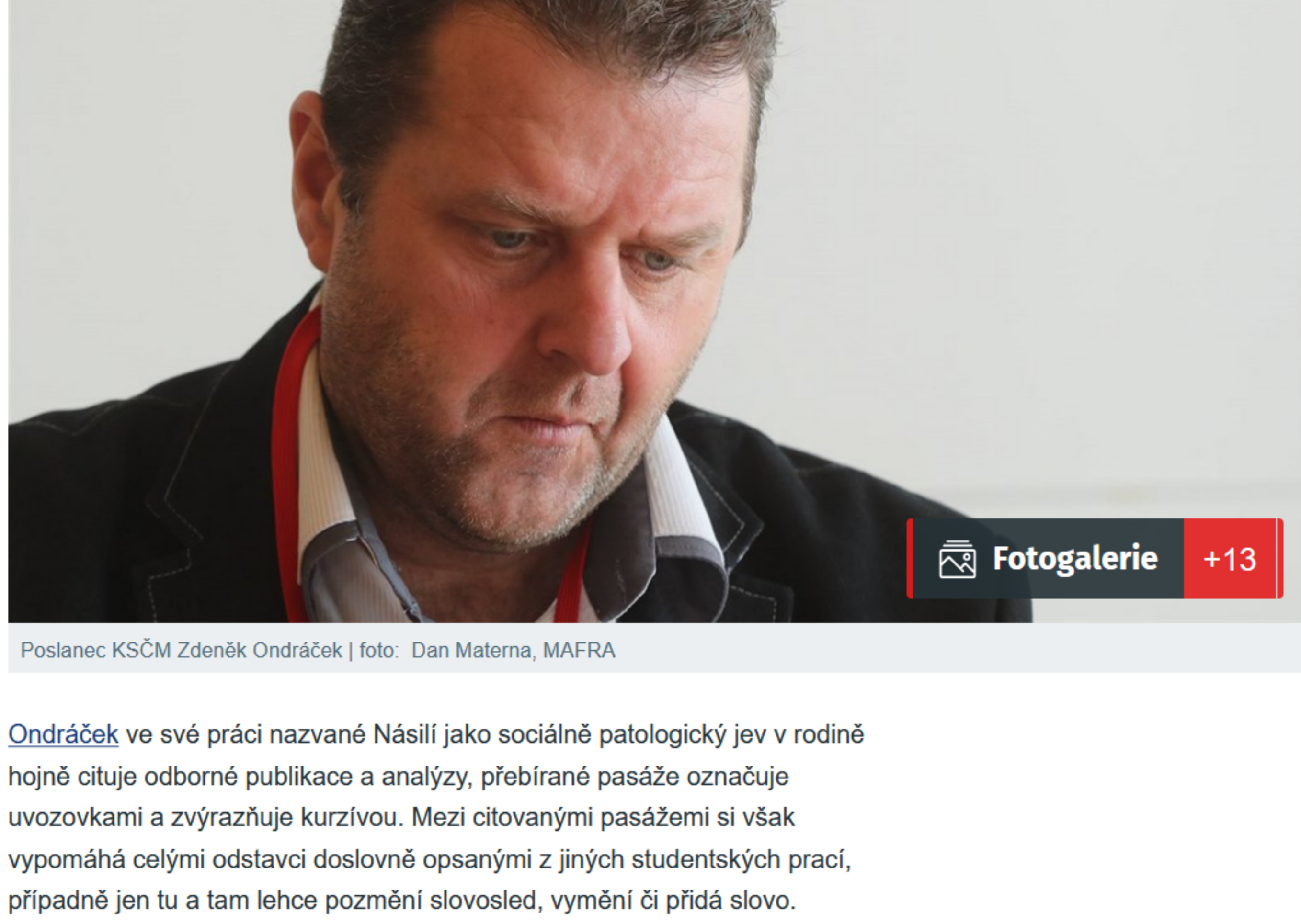
Poslanec KSČM Zdeněk Ondráček

Komunistický poslanec Zdeněk Ondráček opisoval ve své disertační práci, díky níž na Univerzitě Palackého v Olomouci v roce 2011 získal doktorát. Přebírá v ní doslovně celé pasáže prací jiných studentů, aniž by je citoval a uváděl jako zdroj. MF DNES našla několik těchto pasáží, sám Ondráček se redakci nevyjádřil. Na Facebooku jen uvedl, že plagiátorstvím mu je vyhrožováno už delší dobu.