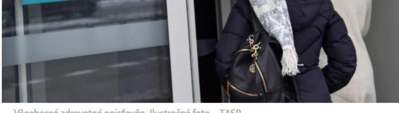
Všeobecná zdravotná poisťovňa.