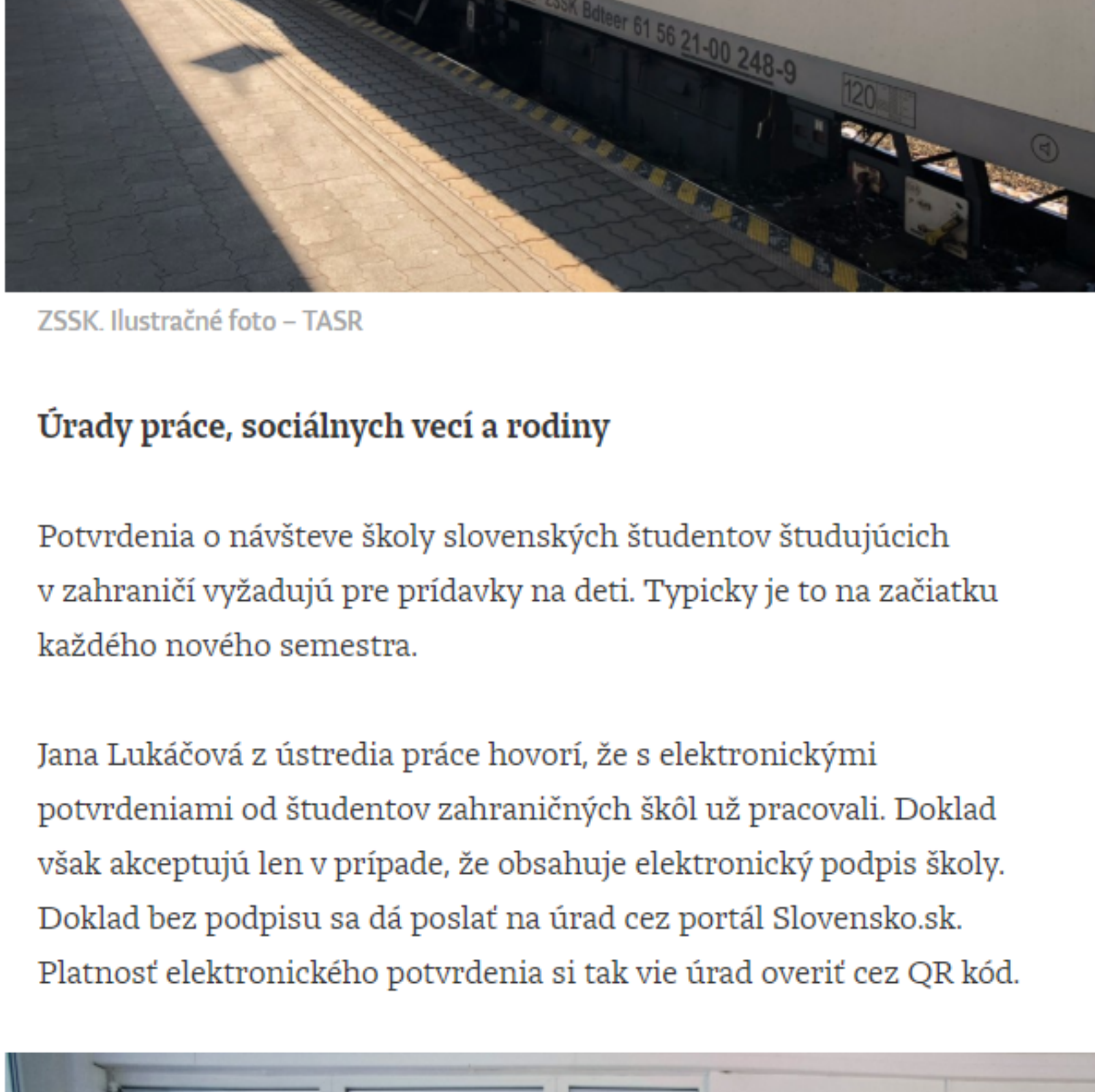
ZSSK. Ilustračné foto – TASR

Na bratislavskej hlavnej stanici mal Denník E horšie skúsenosti – potvrdenie síce pracovníci ZSSK uznali, proces však trval zhruba hodinu. Študenta najprv poslali od okienka do zákaznického centra a následne mali problém načítať QR kód.