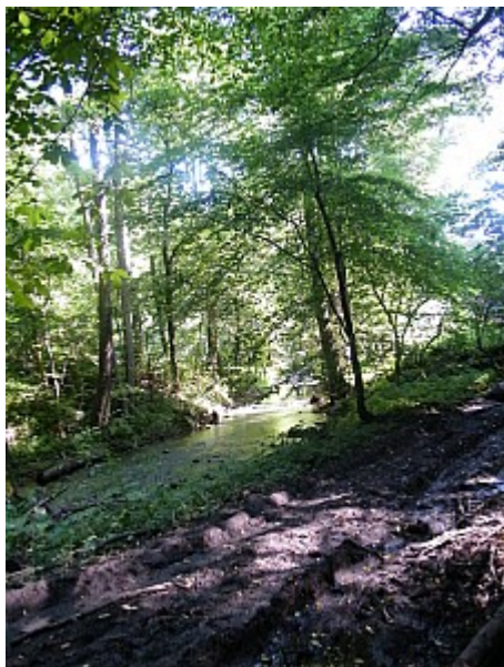
01 Křtinský potok