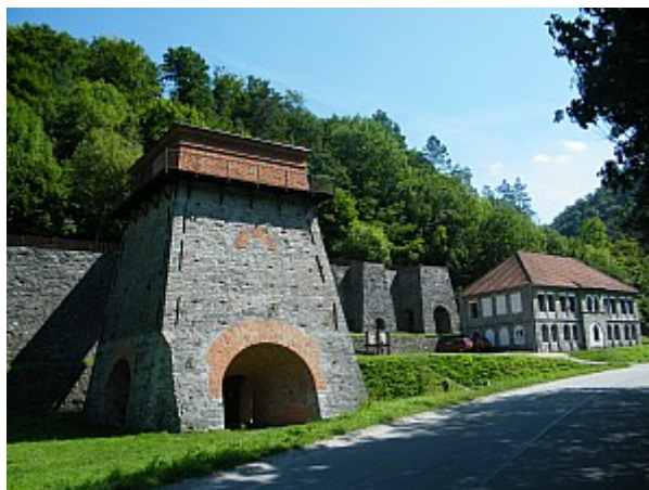
02 huť Františka