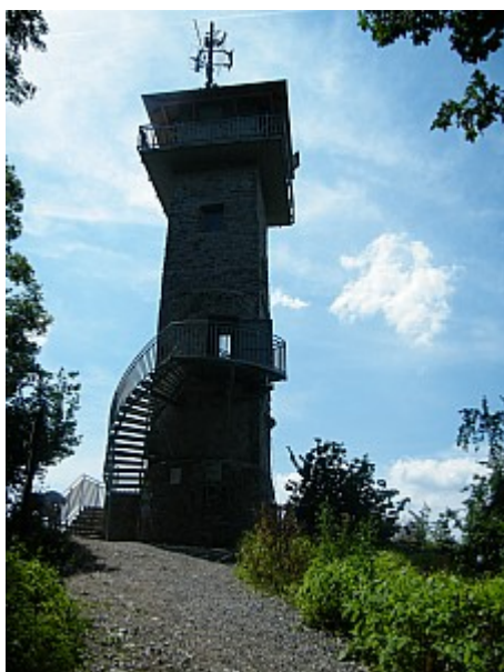
05 Alexandrova rozhledna