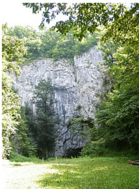
04 Býčí skála