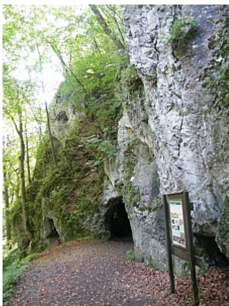
03 jeskyně Jáchymka