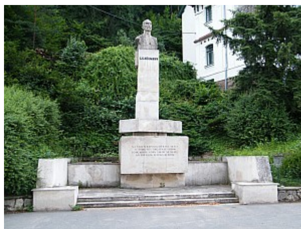
04 Stanislav Kostka Neumann