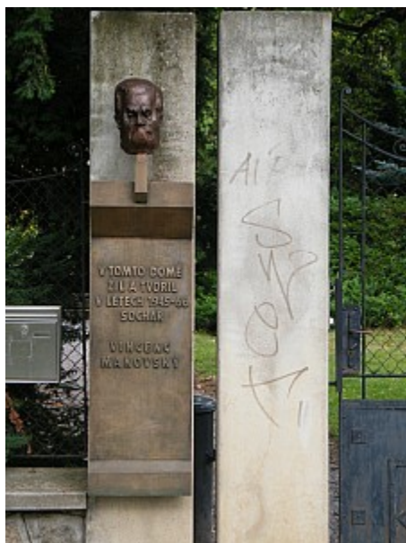
05 pamětní deska