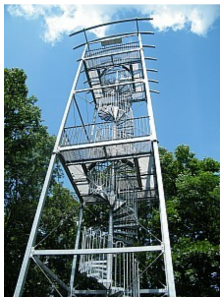
08 Ostrá horka