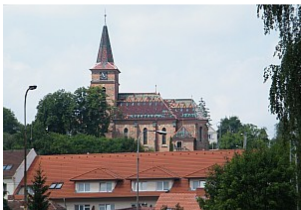
03 kostel sv.Cyrila a Metoděje