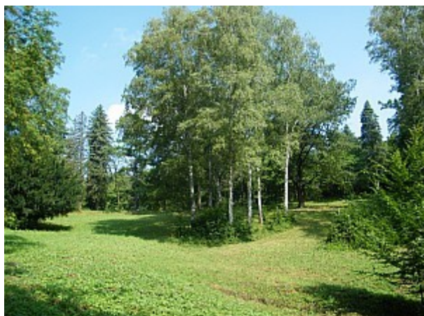
01 palouk U luže