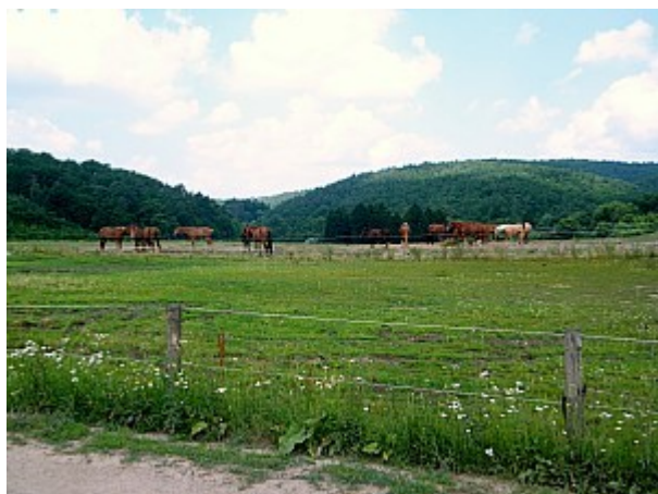
07 výběh pro koně