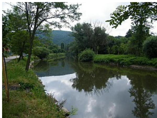
02 řeka Svitava