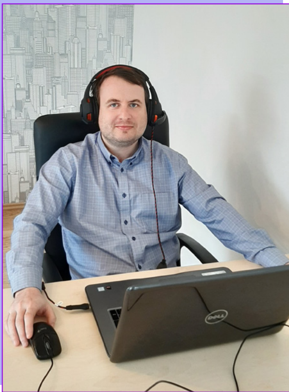
Distanční výuka v jarním semestru 2020