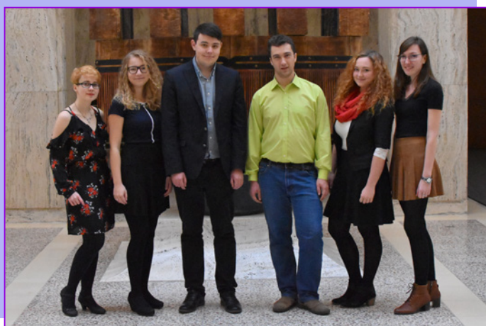
Zakládající členové CIR z řad magisterských studentů brněnské právnické fakulty.