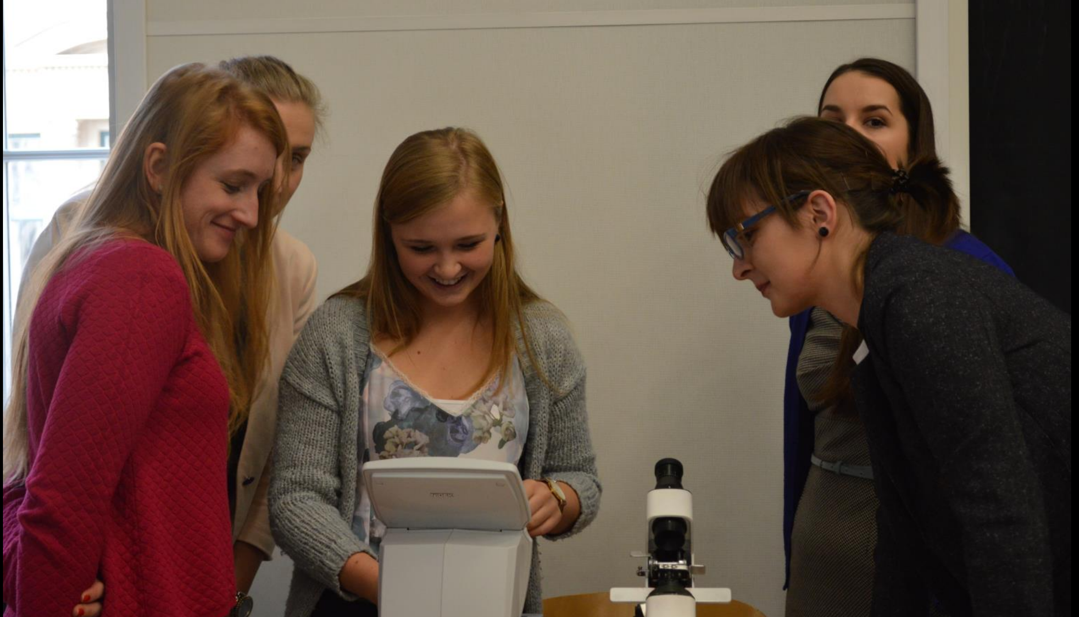
FOKOMETRY A ZAKRÝVACÍ ZKOUŠKA – workshop pro studenty prvních ročníků na seznámení se základním přístrojem a vyšetřovací technikou