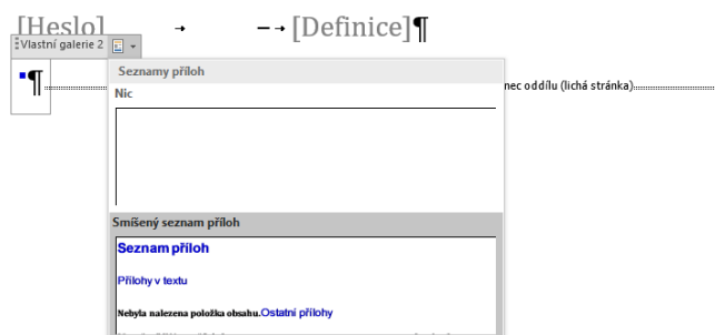
Obr. 2: Vložení seznamu příloh

Vloží se blok, který má dvě části – Přílohy v textu a Ostatní přílohy.