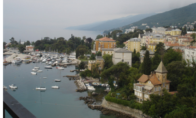
Kongresový sál hotelu Ambassador Opatija a výhled z hotelu

částí, kde jsme rozdělili základní druhy výpadků zorného pole, vyšetřovací metody a ukázali některé učebnicové i klinické příklady perimetrických vyšetření. Následovala praktická část workshopu, kde si účastníci mohli vyzkoušet práci na perimetru OCTOPUS 300 firmy Haag-Streit.