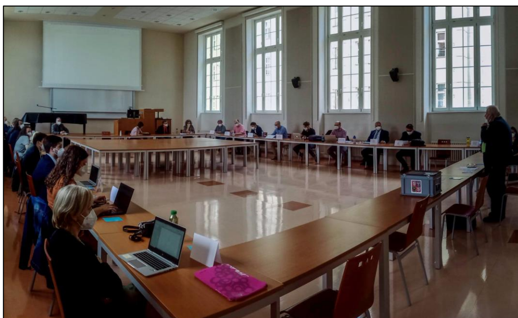
První zasedání nově zvoleného akademického senátu