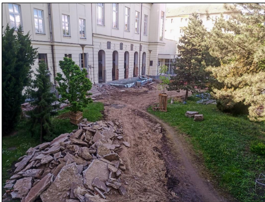
Stavba menzy v květnu 2021