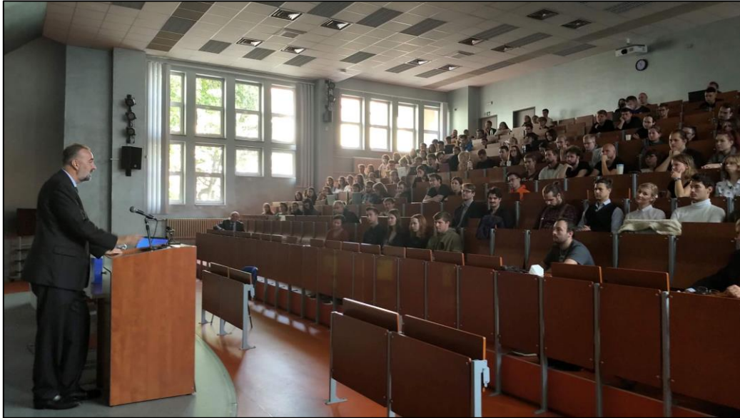
Přednáška Karla Habsbursko-Lotrinského

Pozitivní ohlas učitelské veřejnosti pak vzbudilo vydání didaktických karet BEZRÁKOSKY, které přehlednou formou napomáhají učitelům řešit kázeňské problémy.