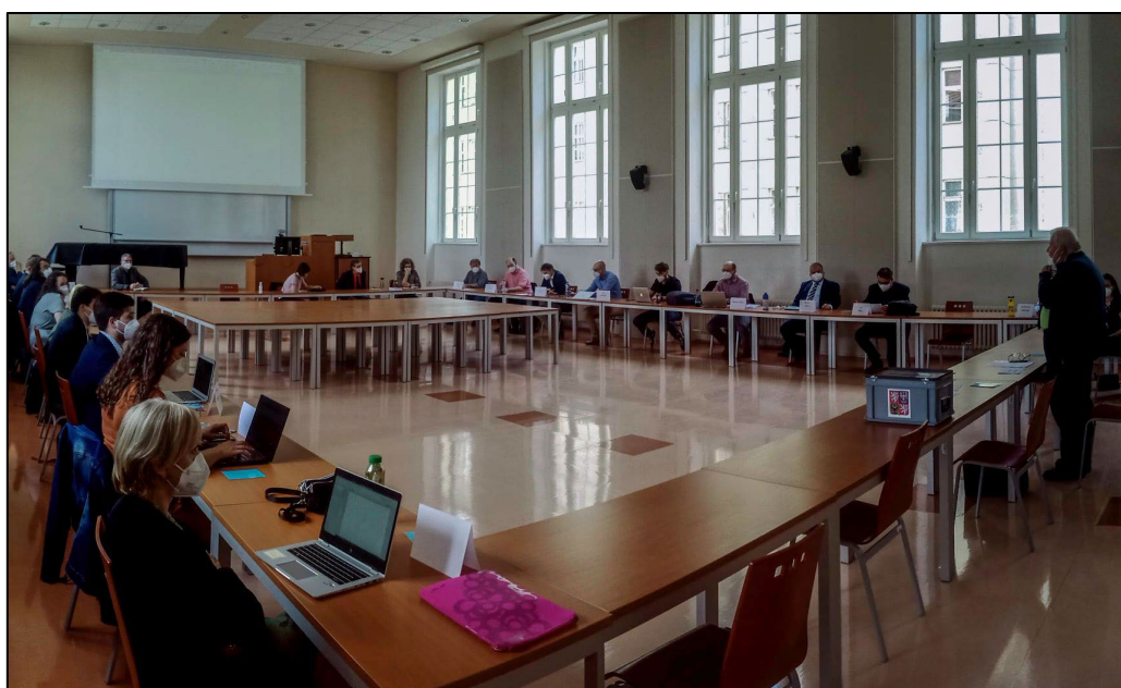
První zasedání nově zvoleného akademického senátu