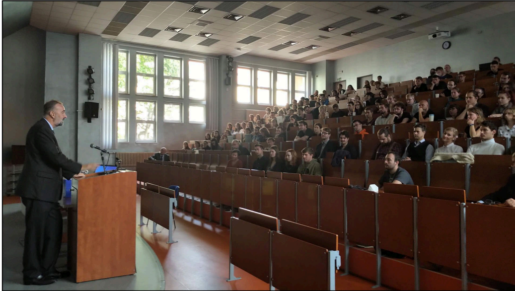
Přednáška Karla Habsbursko-Lotrinského

Pozitivní ohlas učitelské veřejnosti pak vzbudilo vydání didaktických karet BEZRÁKOSKY, které přehlednou formou napomáhají učitelům řešit kázeňské problémy.