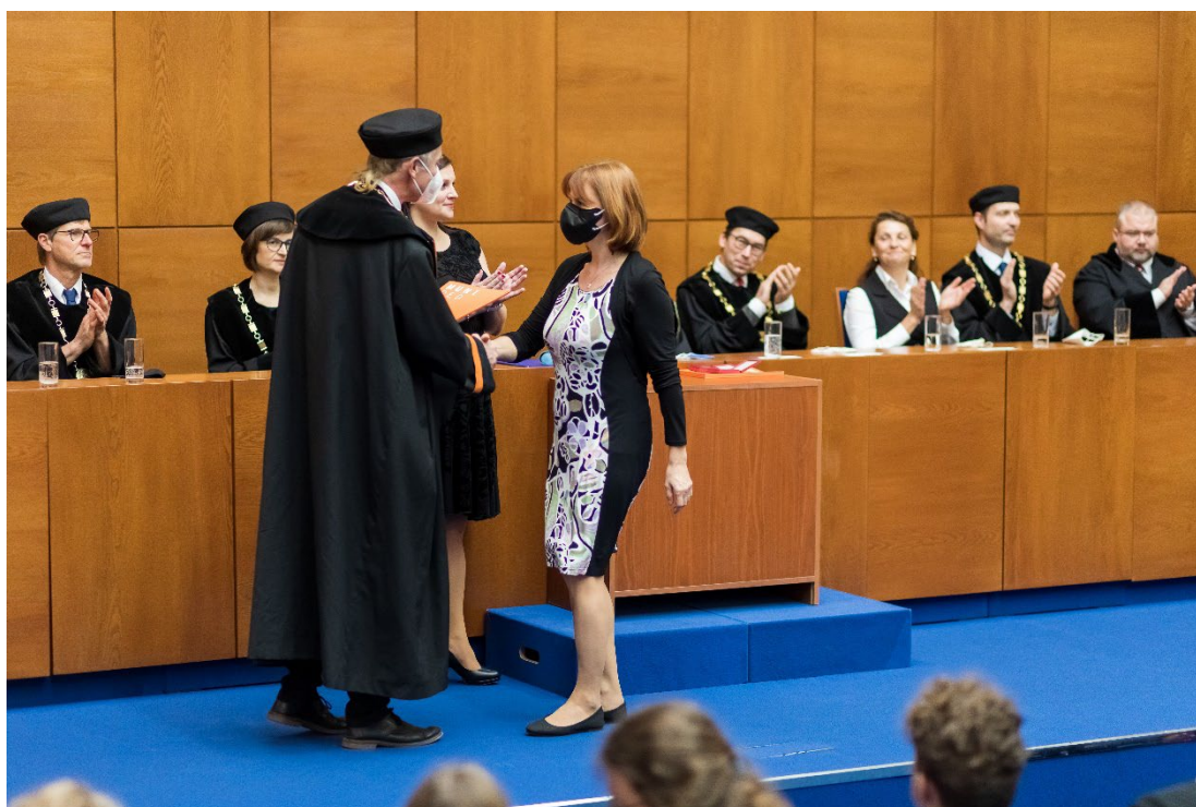
Předávání cen Pedagog roku 2021