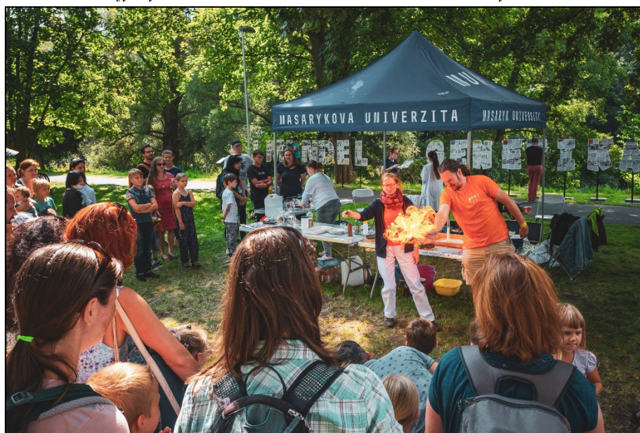
Katedra fyziky, chemie, a odborného vzdělávání na Festivalu vědy s JMK 2021

V září roku 2021 se katedra biologie a katedra fyziky, chemie, a odborného vzdělávání zúčastnily Festivalu vědy s JMK 2021, který se uskutečnil na Letním koupališti Riviéra za velkého zájmu veřejnosti.