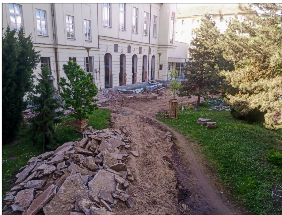
Stavba menzy v květnu 2021