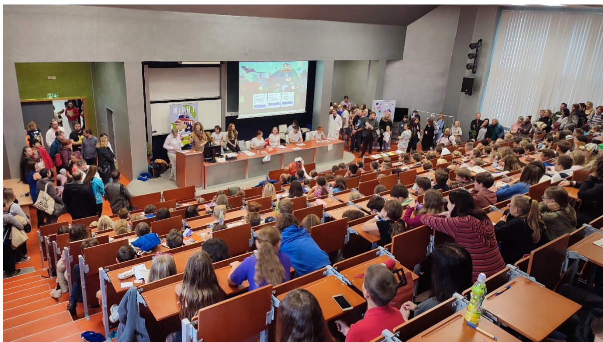
15. 10. 2022 fakulta přivítala téměř 250 dětí a jejich rodičů během dětské univerzity MjUNI.

V září se fakulta účastnila dvou velkých akcí. První byl Festival vědy 2022, který proběhl na Brněnském výstavišti. Zde měli návštěvníci akce nachystaný program, který připravily katedra matematiky, katedra německého jazyka a literatury a katedra biologie a katedra fyziky, chemie a odborného vzdělávání. Následně se fakulta zúčastnila Noci vědců v prostorách Mendelova muzea. Akce probíhala všemi smysly, takže si návštěvníci vyzkoušeli orientaci v prostoru, chemické pokusy, mohli se zapojit do matematických her a kvízů. Na ochutnání nechyběly ani speciality z Francie, Německa a Ruska.