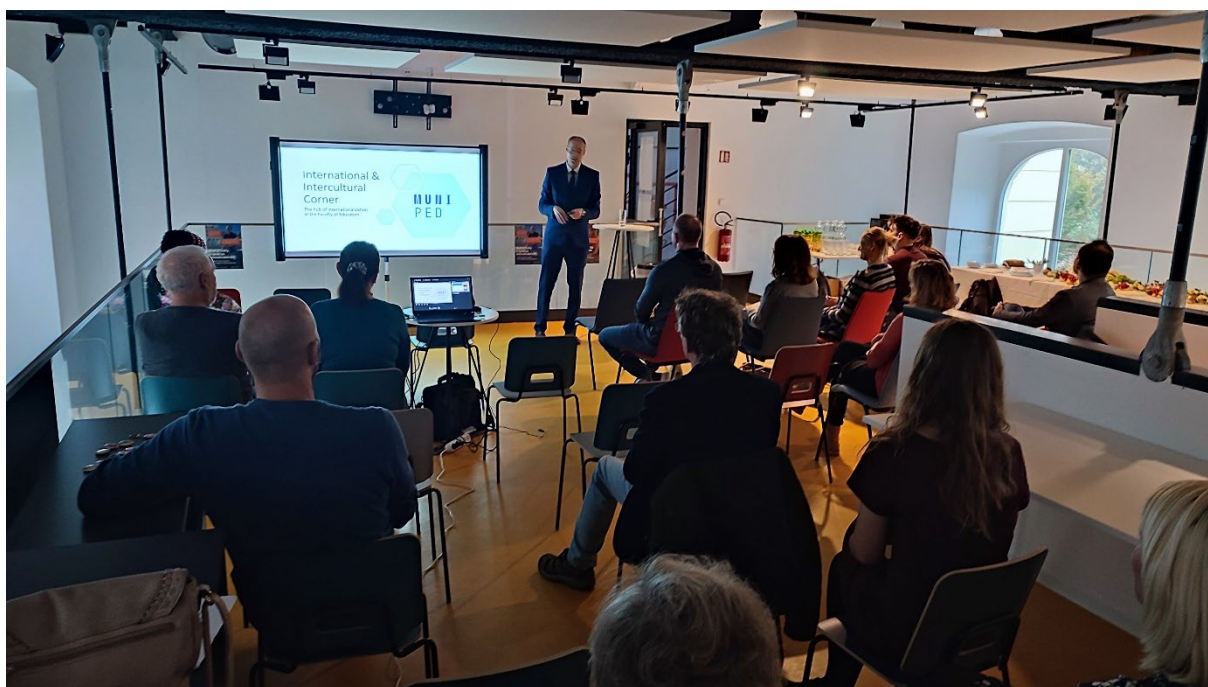
Otevření International and intercultural corner

V prostorách nově vybudované menzy byl otevřen prostor pro setkávání zahraničních a českých studentů, tzv. Interculture Corner. Ten slouží také k přednáškám a prezentacím a jsou zde pořádány například akce Erasmus nights, kde zahraniční studenti představují své země a univerzitu.