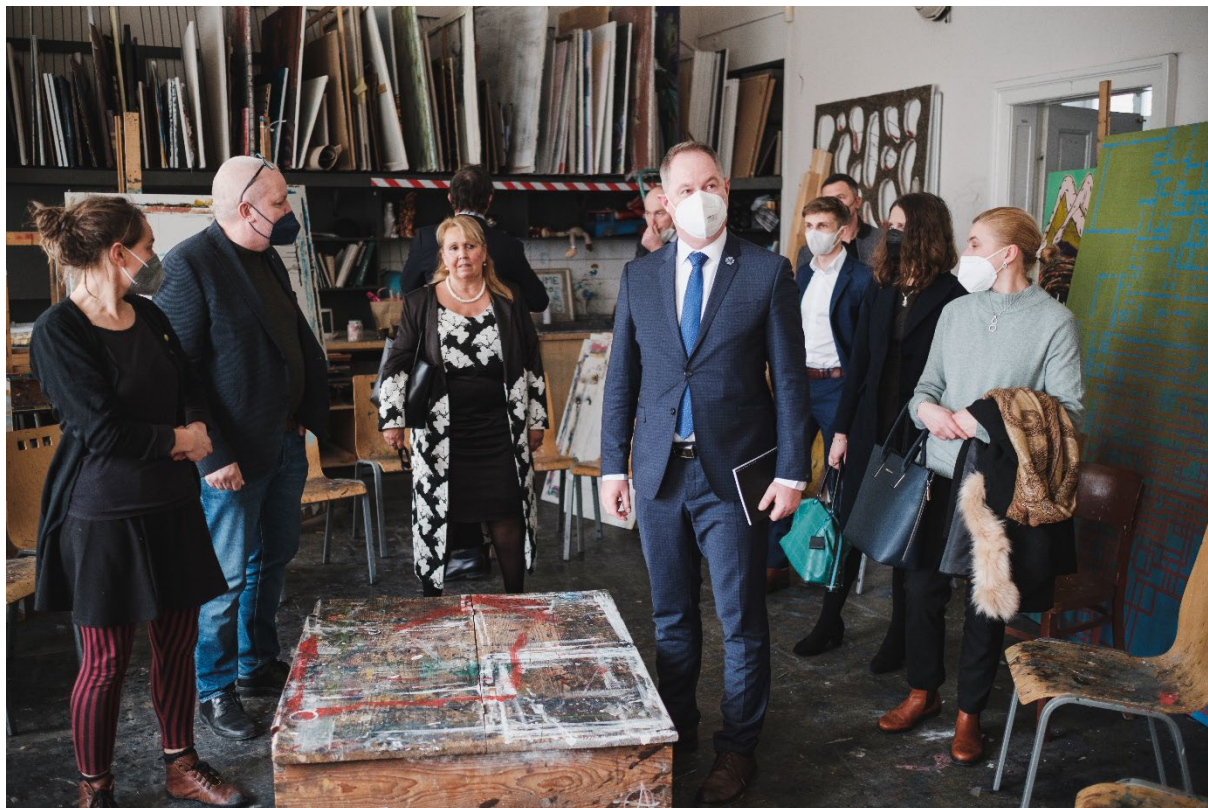
Návštěva ministra Gazdíka na fakultě