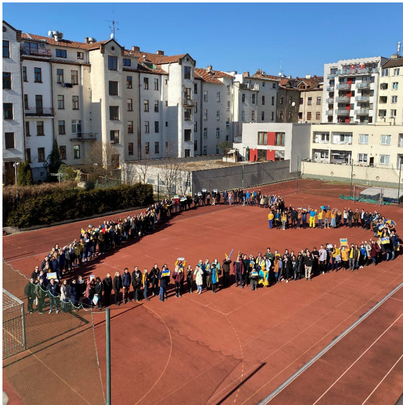
Shromáždění studujících a akademických pracovníků na podporu Ukrajiny

V důsledku ruské invaze probíhaly během celého roku workshopy a akce na podporu Ukrajiny. V létě se na fakultě uskutečnil příměstský tábor pro děti se zdravotním postižením z Ukrajiny.