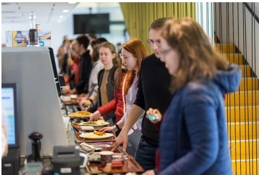
Zahájení provozu fakulní menzy

Začátkem roku fakulta dokončila výstavbu nové menzy, která zahájila provoz 11. 4. 2022. V březnu rok 2022 byla zároveň zahájena výstavba nových ateliérů Katedry výtvarné výchovy PdF MU, které by měly být dokončeny k 31. 8. 2023.