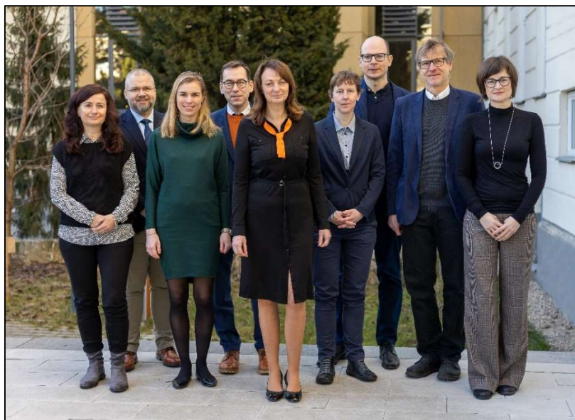
Vedení Pedagogické fakulty Masarykovy univerzity