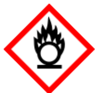
GHS03 - oxidační látky