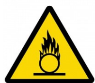
Nebezpečné oxidující látky