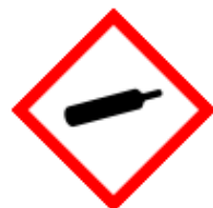
GHS04 - plyny pod tlakem