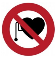
Zákaz vstupu s kardiostimulátorem