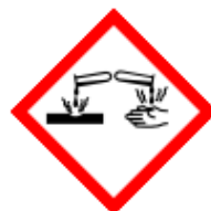
GHS05 - korozivní a žíravé látky