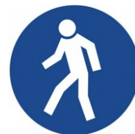
Pěší musí použít tuto cestu