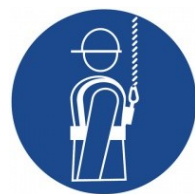
Použij výstroj k upoutání