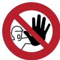
Zákaz vstupu nepovolaným osobám