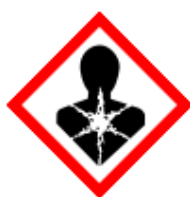
GHS08 – látky nebezpečné pro zdraví