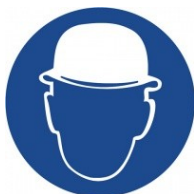
Nasaď ochrannou přilbu!