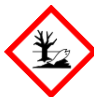
GHS09 - látky nebezpečné pro životní prostředí