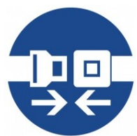
Použij bezpečnostní pás