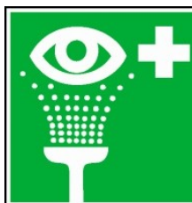
Zařízení pro vyplachování očí

Informativní značky pro označení věcných prostředků požární ochrany a požárně bezpečnostních zařízení