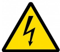
Nebezpečí - Elektřina