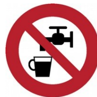
Voda nevhodná k pití