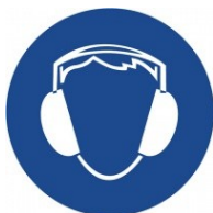
Použij chrániče sluchu!