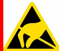
Zařízení citlivé na elektrostatický náboj