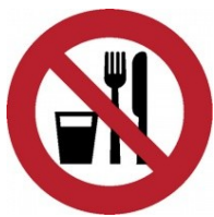
Zákaz jídla a pití