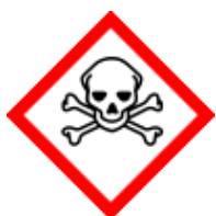
GHS06 - toxické látky