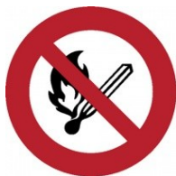
Zákaz vstupu s otevřeným ohněm

Značky zákazu - mají kruhový tvar s černým piktogramem na bílém pozadí