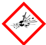
GHS01 - výbušné látky