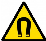
Silné magnetické pole