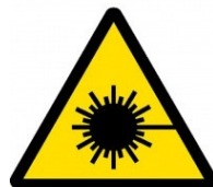
Nebezpečné laserové zařízení