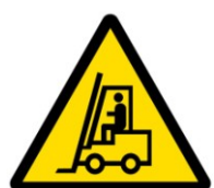
Nebezpečí střetu s vozíky