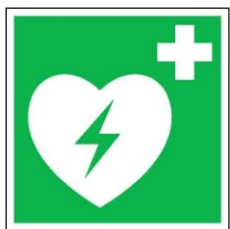
Automatický externí defibrilátor