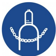
Zajisti plynové láhve!