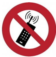
Zákaz používání mobilního telefonu