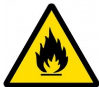
Požárně nebezpečné látky