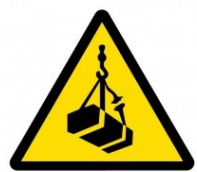
Nebezpečný zavěšený náklad