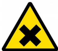
Škodlivé nebo dráždivé látky