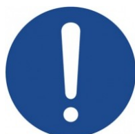
Obecné vyjádření příkazu