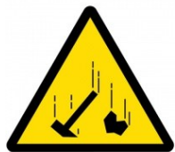
Nebezpečí úrazu padajícími předměty