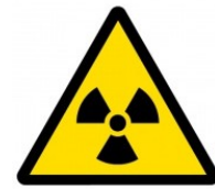
Nebezpečné radioaktivní látky