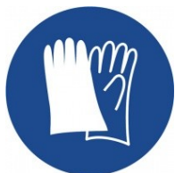
Používej ochranné rukavice