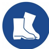
Nos ochrannou obuv!