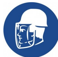
Použij ochranný štít!