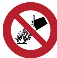
Zákaz použití vody pro hašení