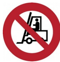
Zákaz provozu motorových vozíků