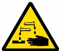
Riziko koroze nebo poleptání