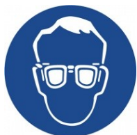
Používej ochranné brýle