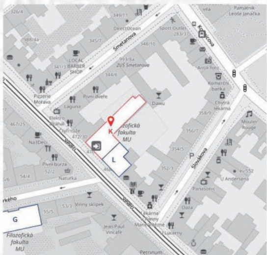
Veverí 18, Brno, přízemí, Knihovna Hanse Beltinga