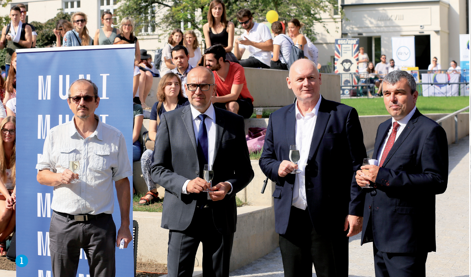
1. 4 Rok 2018 v obrazech