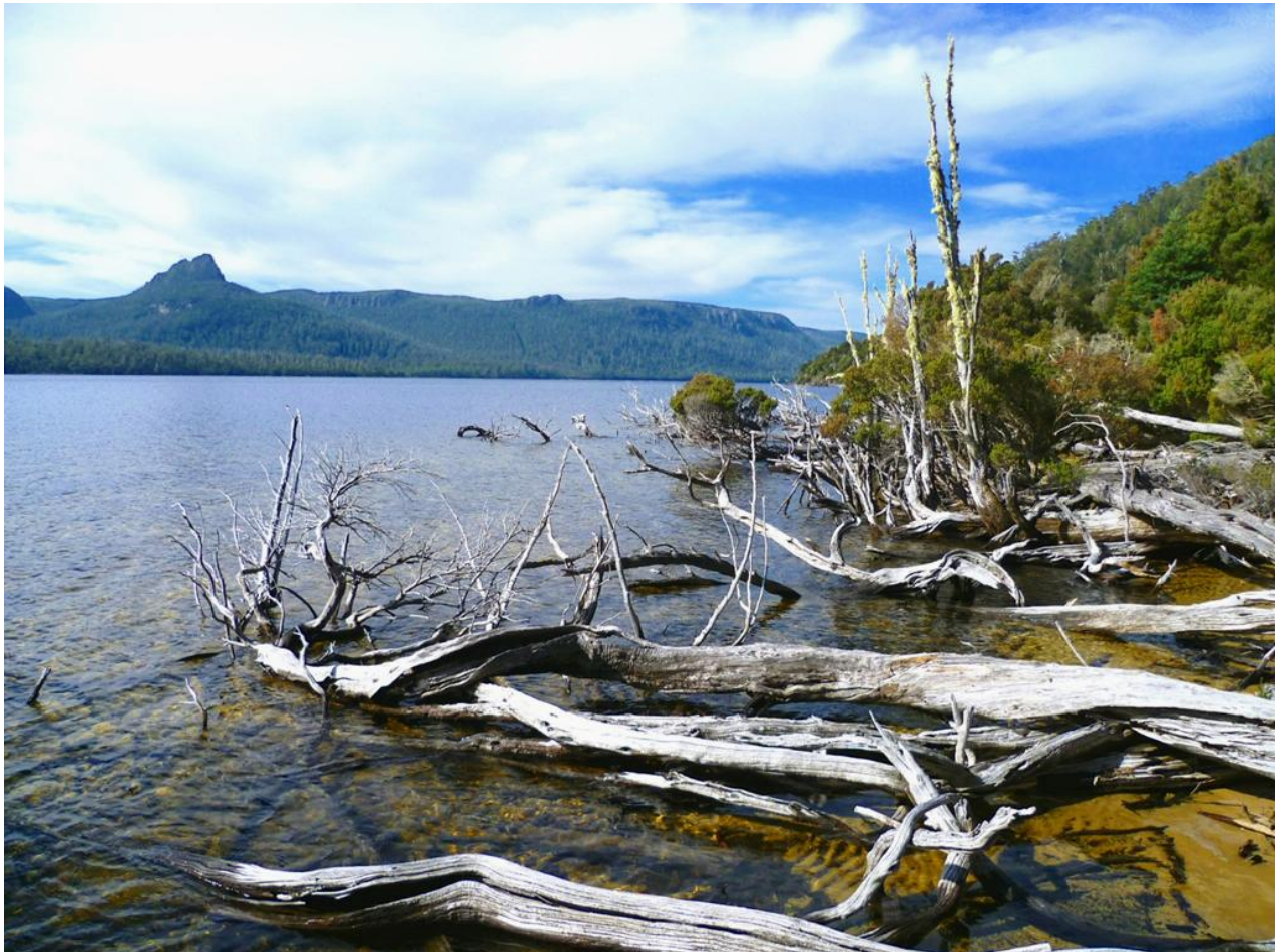
Jezero St. Clair, hladina v 739 m, uměle mírně zvýšena, hloubka až 167 m. Jezero bylo vyhloubeno dlouhým údolním ledovcem.