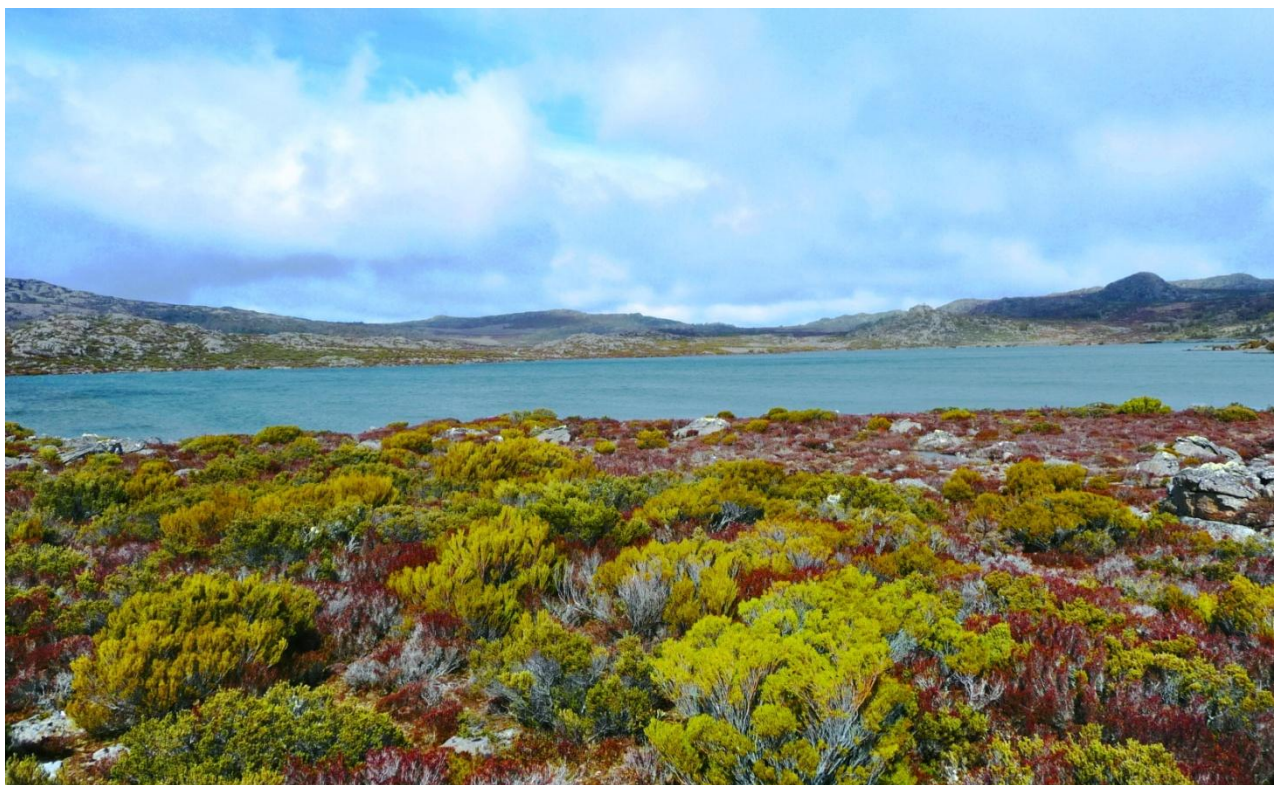
Bezejmenné jezero – Lake Nameless leží na zarovnaném povrchu ve výšce 1200 m n.m. Patří k nejvýše položeným větším jezerům, již nad hranicí lesa.