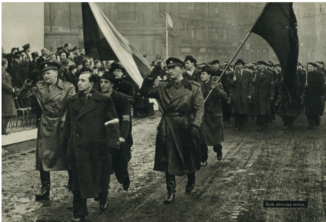
Štáb dělnické milice.