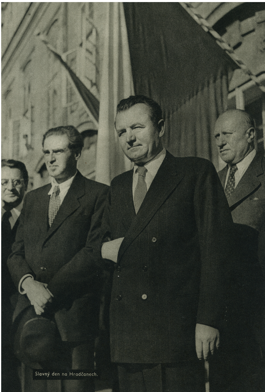
Slavný den na Hradčanech.