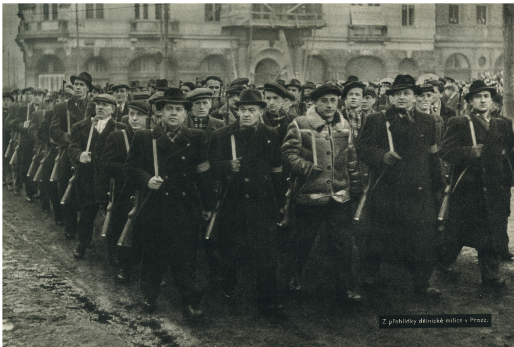
Z přehlídky dělnické milice v Praze.