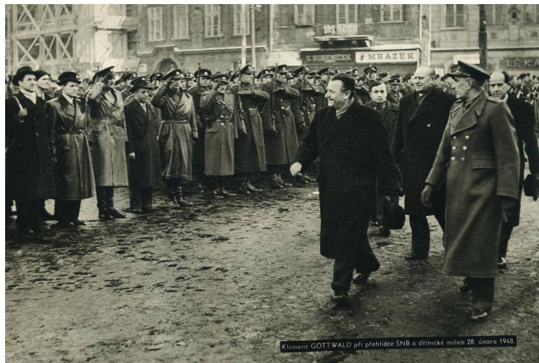
Klement GOTTWALD při přehlídce SNB a dělnické milice 28. února 1948.