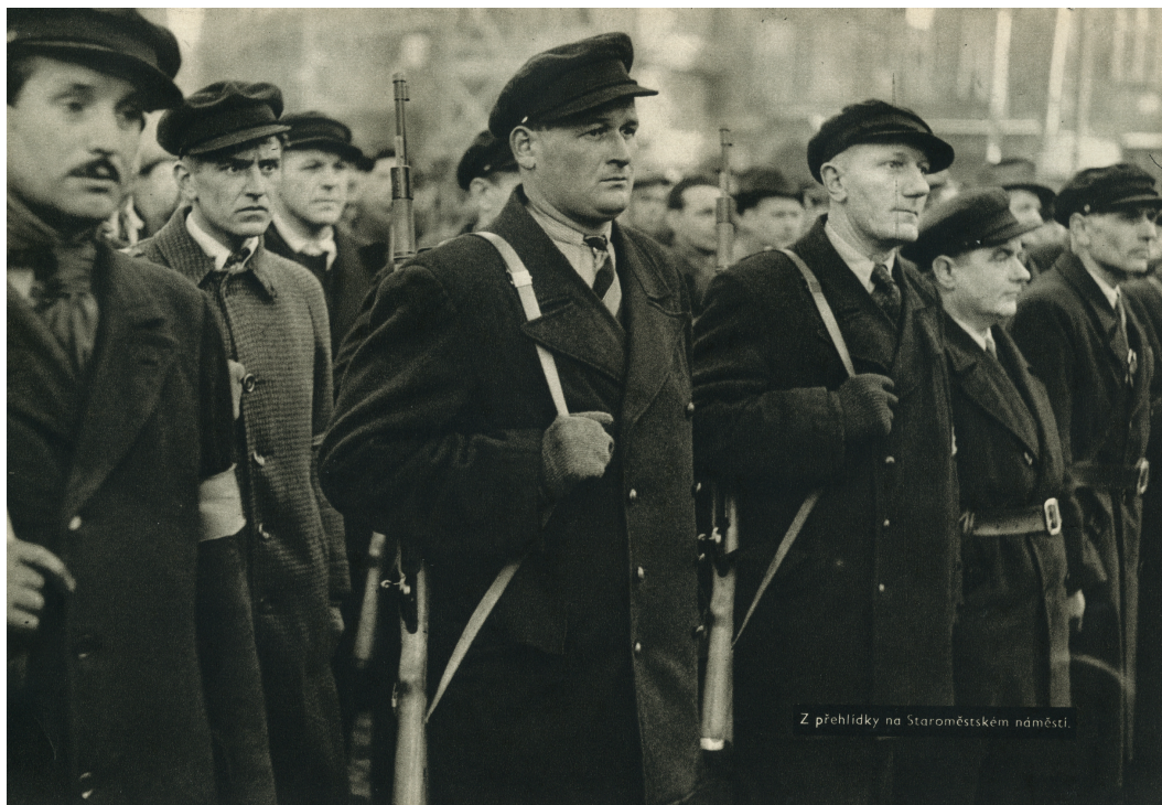
Z přehlídky na Staroměstském náměstí.