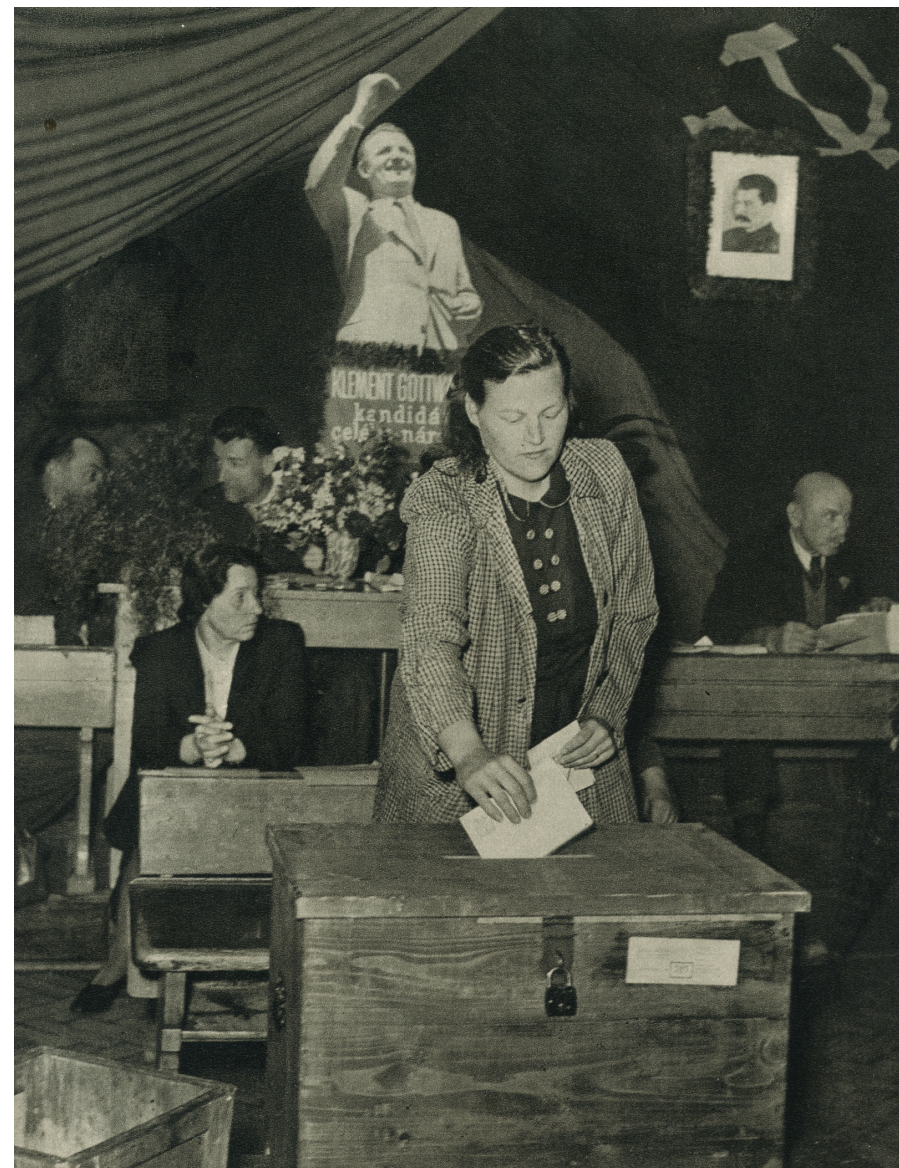
V svobodných, demokratických volbách se náš lid jednotně vyslovil pro kandidátku obrozené Národní fronty.

Klement Gottwald v projevu k Ústavodárnému Národnímu shromáždění 10. 3.1948