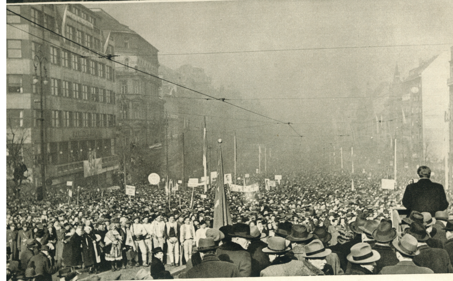
Klement GOTTWALD zdraví sjezd rolníků.