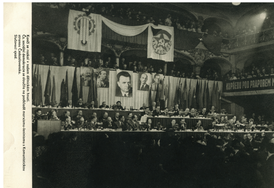
Končí se rozkol v našem dělnickém hnutí. Čs. sociální demokracie se sloučila na podkladě marxismu-leninismu s Komunistickou stranou Československa. Slučovací sjezd.