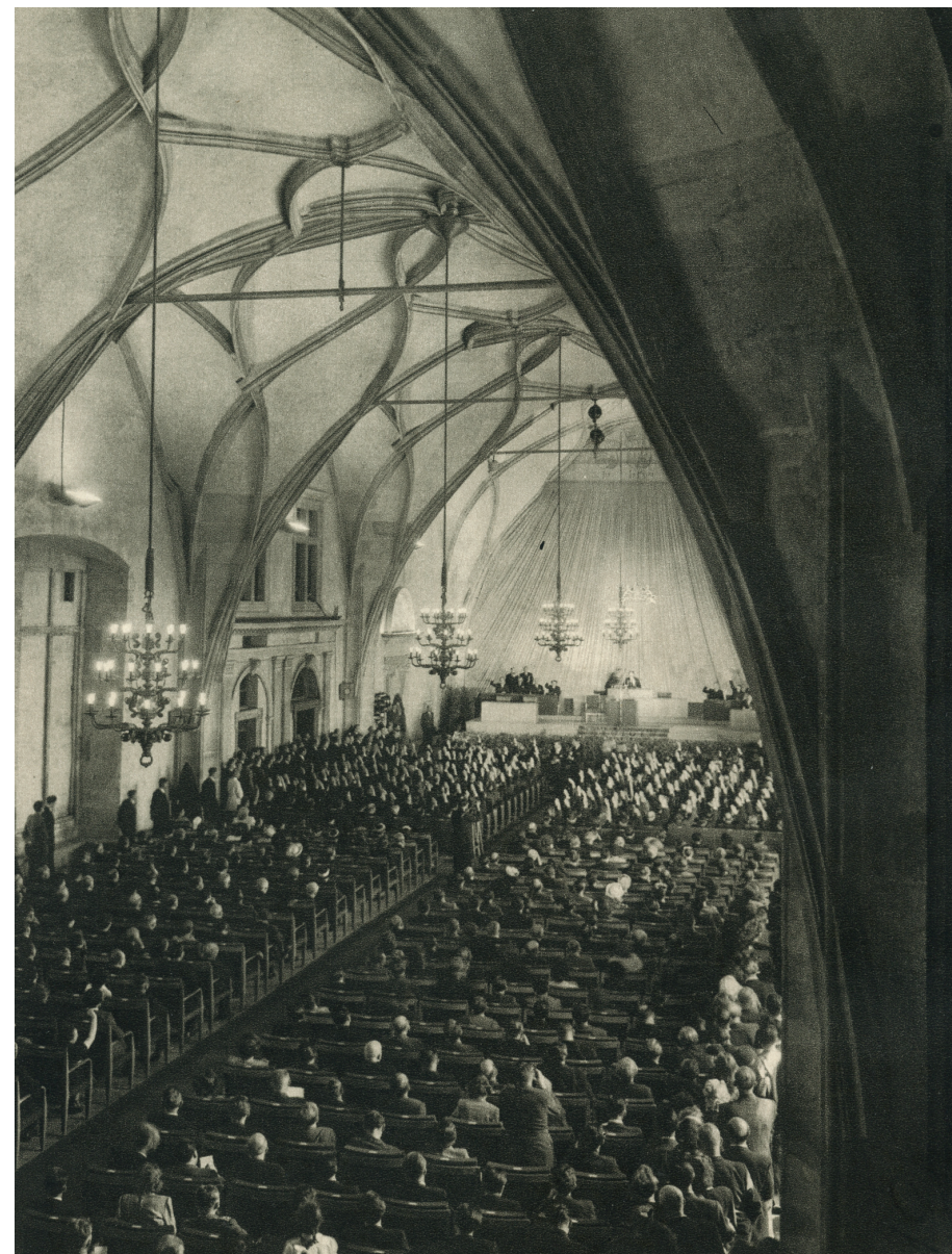
Vladislavský sál při volbě prezidenta.