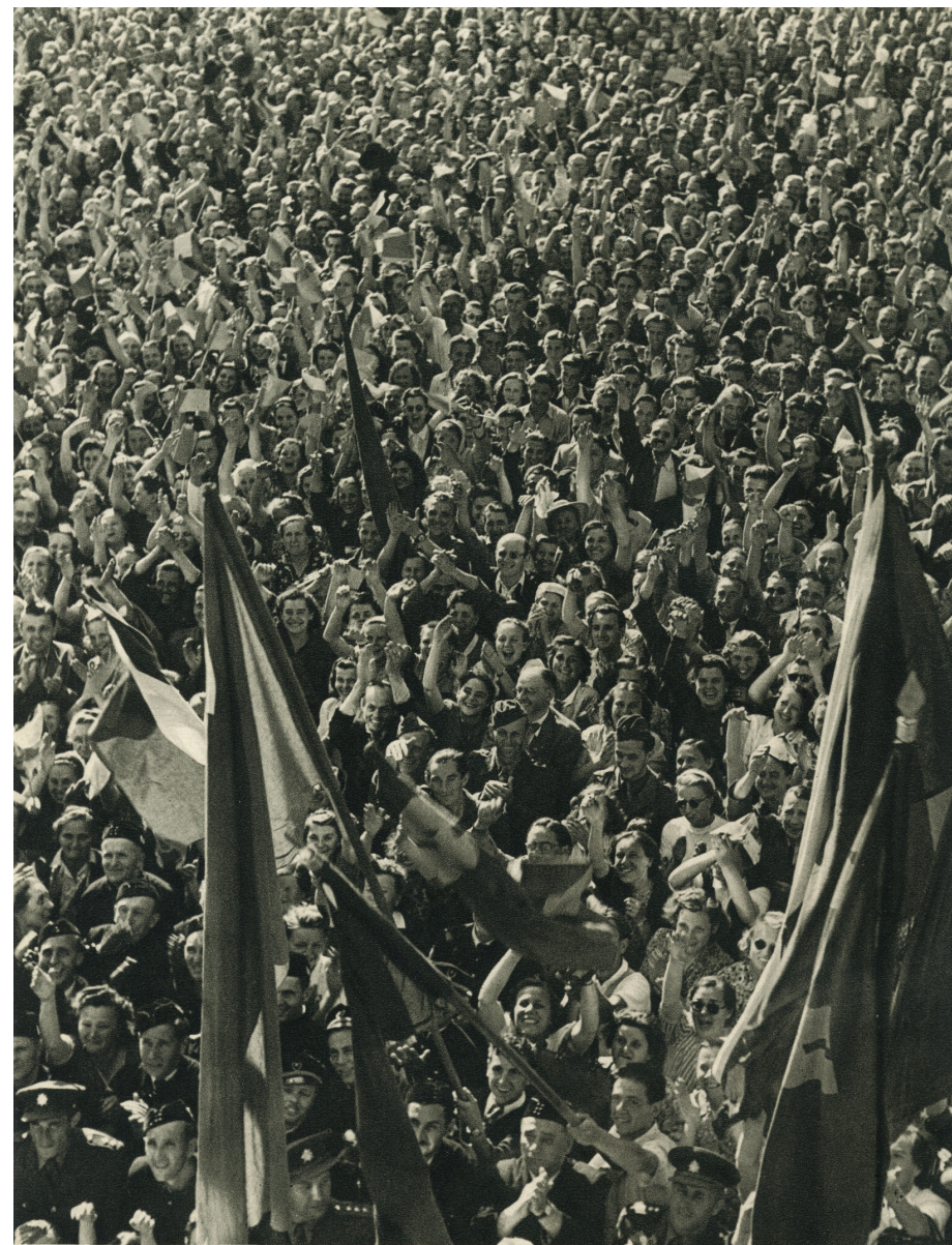
Únorem otevřel si náš pracující lid cestu k šťastné socialistické budoucnosti.