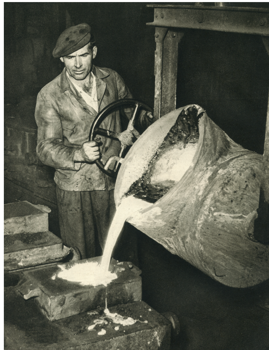
Konečně začala práce bez svárů a štvanic.