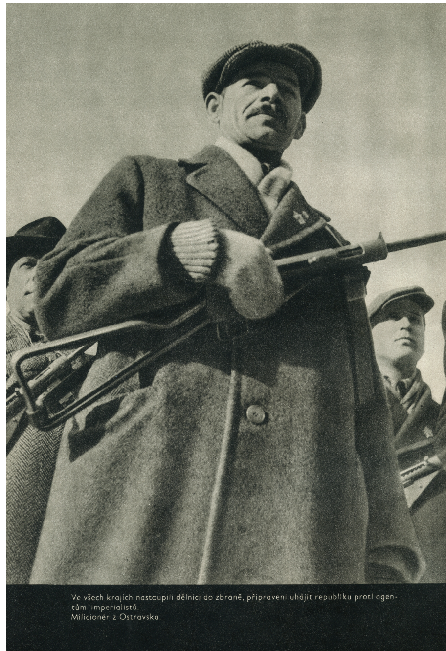
Ve všech krajích nastoupili dělníci do zbraně, připraveni uhájit republiku proti agentům imperialistů. Milicionér z Ostravska.