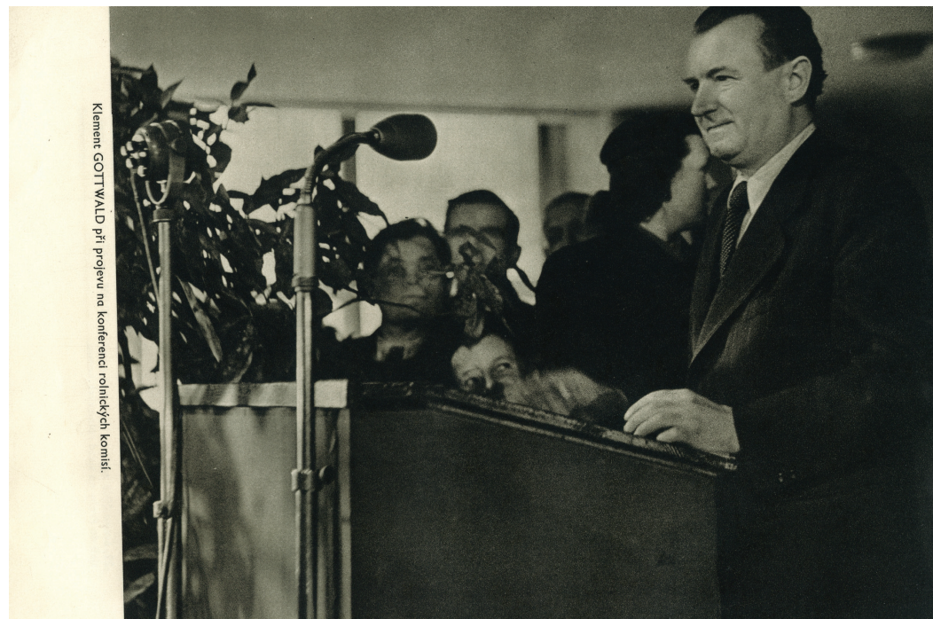
Klement GOTTWALD při projevu na konferenci rolnických komisí.