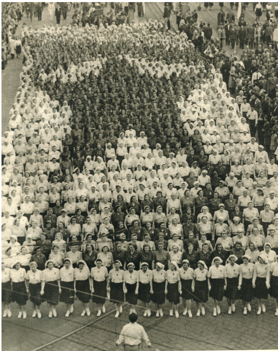
Z májového průvodu KSČ 1. května 1948