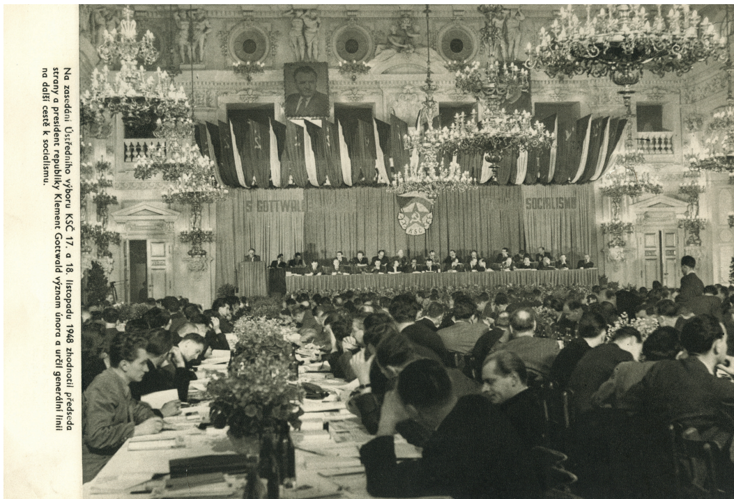
Na zasedání Ústředního výboru KSČ 17. a 18. listopadu 1948 zhotovili předseda strany a prezident republiky Klement Gottwald význam únoru a určili generální linii na další cestě k socialismu.