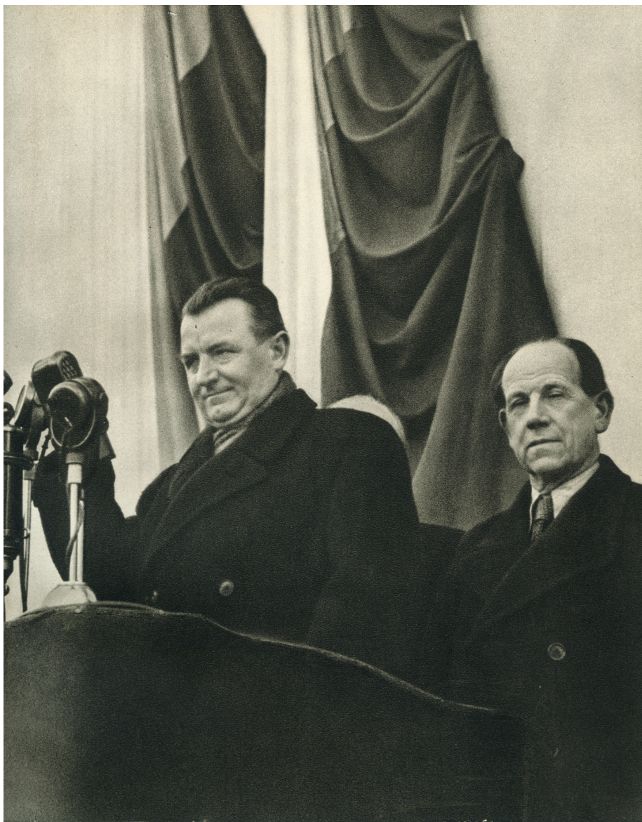
Klement GOTTWALD a Antonín ZÁPOTOCKÝ přehlíží oddíly dělnické milice.