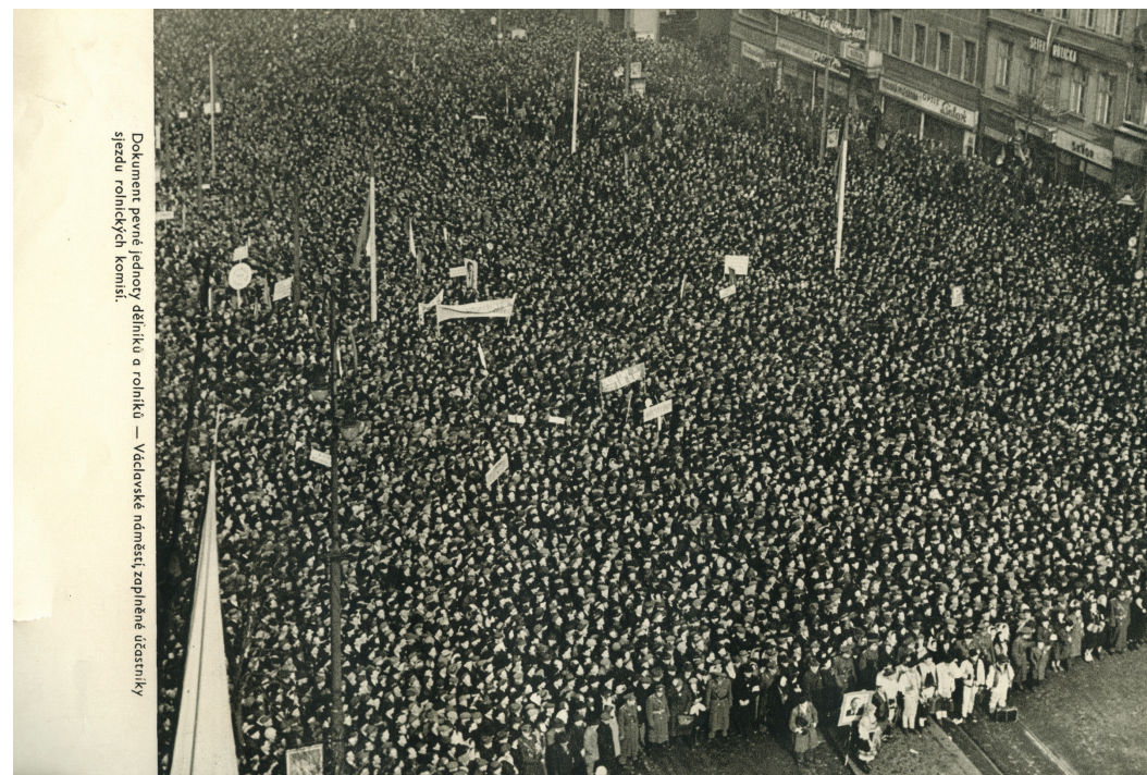
Dokument paně jednorý dělník a rolník — Václavské náměstí, zapsané účastníky sjezdu rolnických komisí.

(Z projevu Klementa Gottwalda na sjezdu 29. února 1948.)