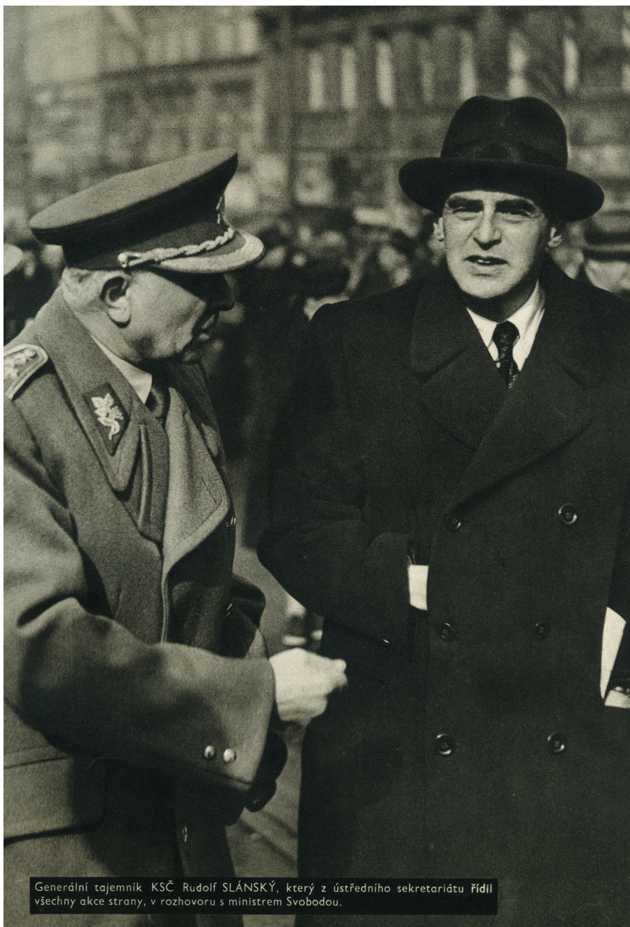
Generální tajemník KSČ Rudolf SLÁNSKÝ, který z ústředního sekretariátu řídil všechny akce strany, v rozhovoru s ministrem Svobodou.