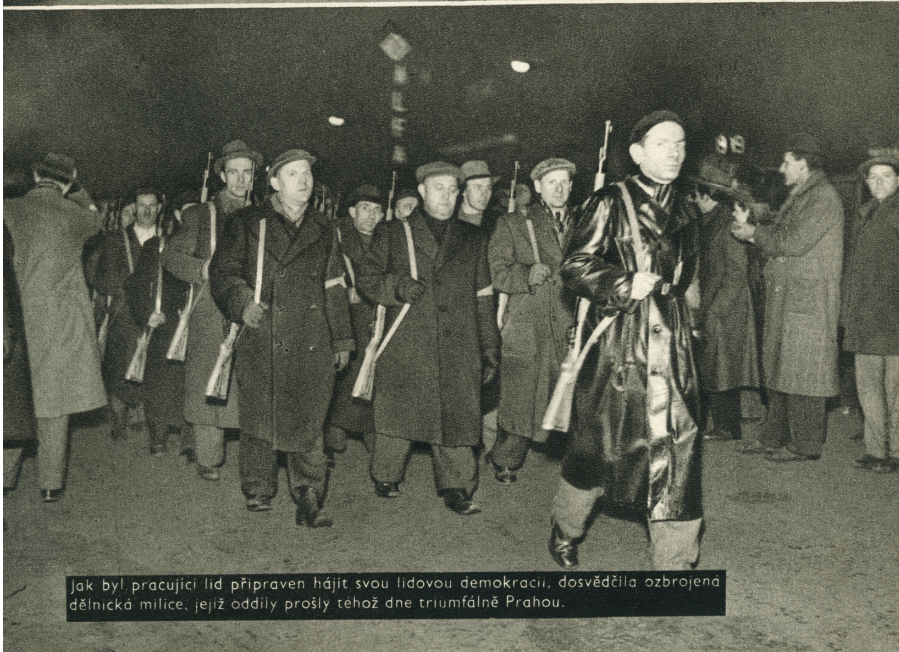
Jak byl pracující lid připraven hájit svou lidovou demokracii, dosvědčila ozbrojená dělnická milice, jejíž oddíly prošly téhož dne triumfálně Prahou.