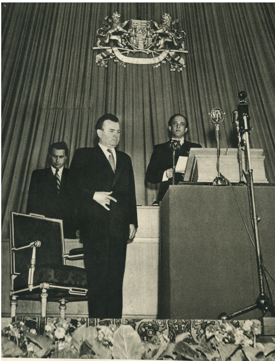
14. června 1948 dovršil pracující lid své únorové vítězství: Klement GOTTWALD byl zvolen prezidentem republiky.