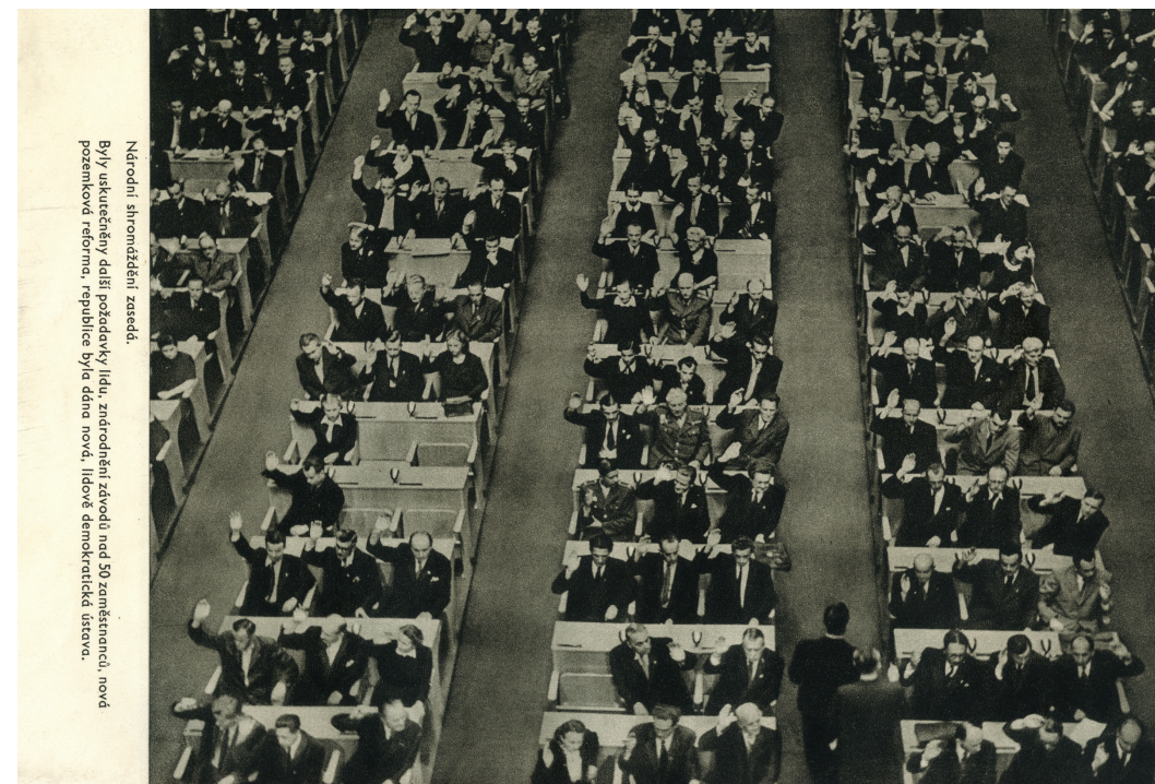
Národní shromáždění zasedá. Byly uskutečněny další požadavky lidu, zvrhnutí zvrhodu nad 50 zaměstnanců, nová pozemková reforma, republika byla dána nová, lidově demokratická ústava.

(Z projevu Klementa Gottwalda 25. února 1948 na Václavském náměstí.)