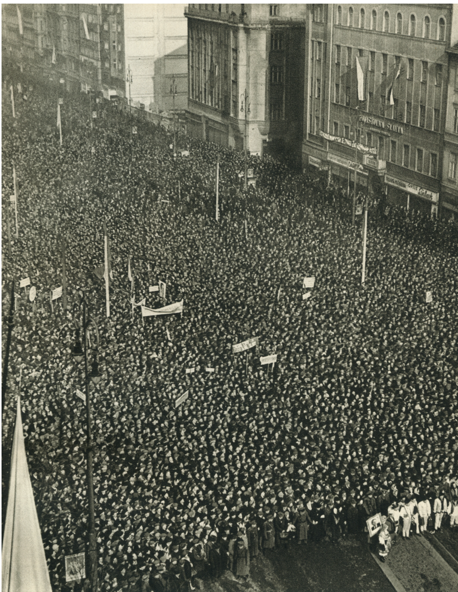
29. února 1948 zaplnilo Václavské náměstí 130.000 zemědělských delegátů, kteří se sjeli do Prahy na sjezd rolnických komisí.