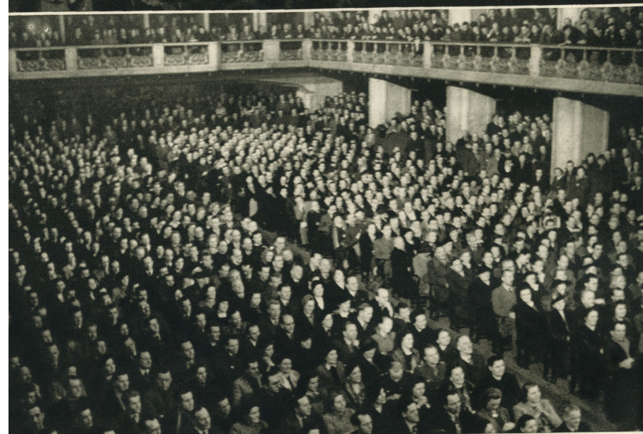
Také kulturní pracovníci sněmovali a manifestovali svou věrnost vládě Klementa Gottwalda.