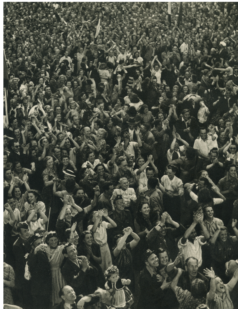
Rozradostněný lid zdraví se na Hradě se svým prezidentem.