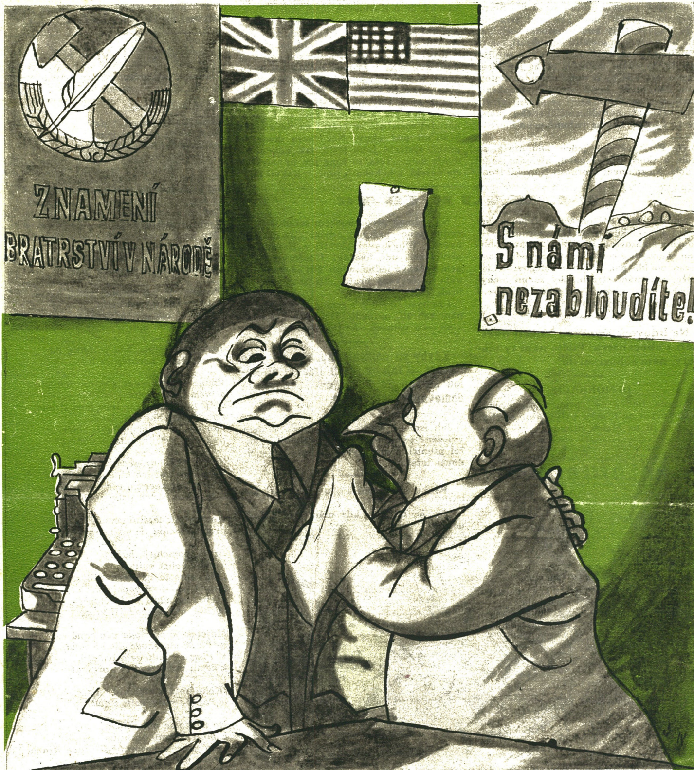
— A nejsmutnější na tom je, že ti komunisti se bratří dokonce se Slovanama!