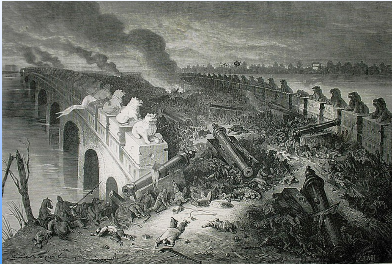
Le pont de Pa-li-Kiao, le soir de la bataille. — Dessin de E. Bayard d'après une esquisse de M. E. Vaumort (album de Mme de Bourboulon).