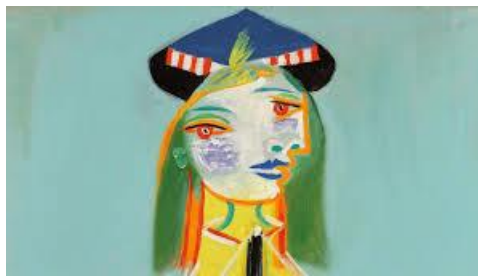
Pablo Picasso, XXe siècle