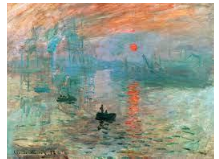
Claude Monet, , XIXe siècle