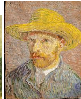
Vincent van Gogh, XIXe siècle