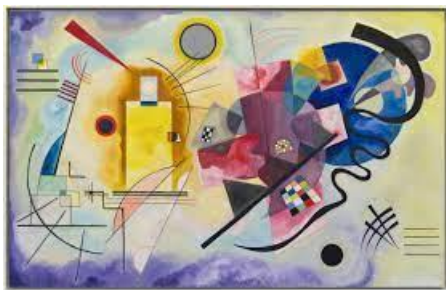
Wassily Kandinsky, XXe siècle