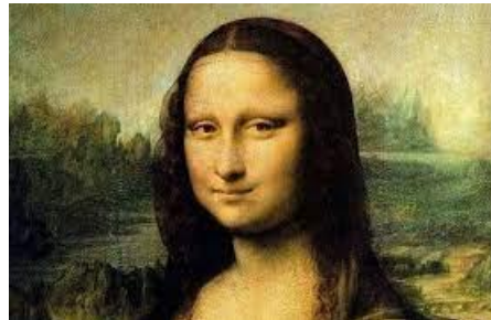
Léonard de Vinci, XVe siècle