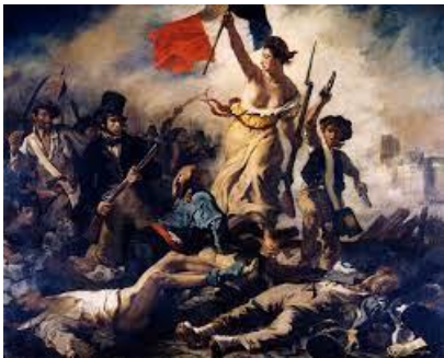
Eugène Delacroix, XIXe siècle