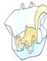
à l'intérieur du sac