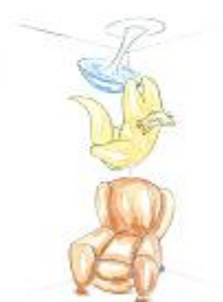
au-dessus du fauteuil