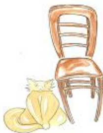
à gauche de la chaise