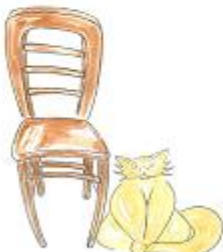
à droite de la chaise