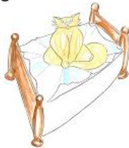
au milieu du lit