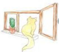
à coté du cactus