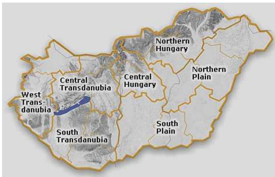
Obrázek 1: Maďarsko - regiony

Podle standardů EU jsou velké regiony jednotkami s počtem 1-3 milionů obyvatel a územím sjednocujícím 2-5 žup, které jsou obvykle porovnávány využitím standardů měřících systémů a indikátorů. V sedmi Maďarských regionech odráží hrubý domácí produkt (HDP) více znevýhodňujících faktorů ve srovnání s regiony EU, proto jsou dotovány pouze ty regiony, kde HDP nedosahuje 75% průměru EU. V případě Centrálního Maďarska (Central Hungary), které je nejrozvinutějším regionem s hlavním městem Budapešť, obrát HDP je právě nad limitem dotace - 76%. Ostatních šest regionů, dokonce dobře rozvinutý Západní Dunántúl (Western Transdanubia), zůstává pod touto úrovní, takže jsou podporovány z fondů EU.