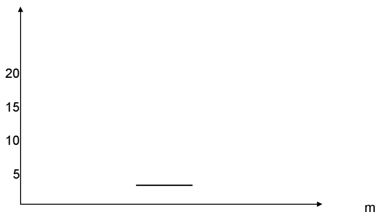
Graf výrobní izokvanty

Cena faktoru r_1 je c_1 a činí 40,- Kč za jednotku, faktoru r_2 je c_2 a činí 60,- Kč za jednotku. Musí podnik pro dosažení požadovaného výrobního množství vynaložit 1 080,- Kč celkových nákladů N_2 nebo postačuje 720,- Kč celkových nákladů N_1 .