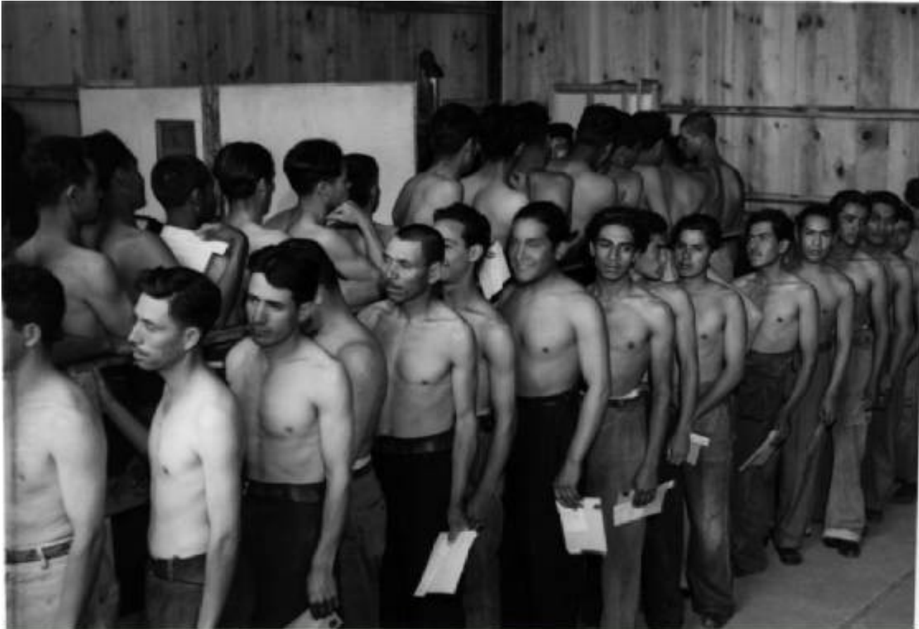
-Bracero Program, 1960s