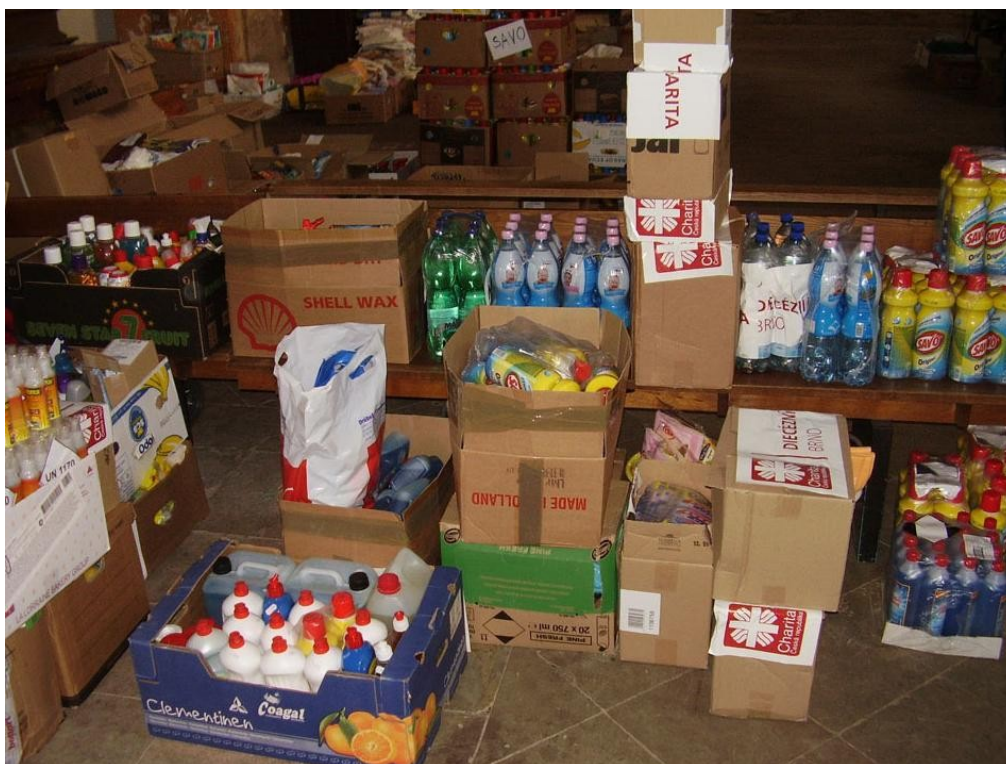
Obrázek 4: Humanitární pomoc při povodních 2013

Charitou nacházející se na zasaženém území. Materiální sbírka může být vyhlášena lokálně nebo na celém území ČR. V případě naléhavé potřeby (v prvních hodinách a dnech, kdy materiální sbírka zatím nemůže uspokojit okamžité požadavky) Charita nakoupí potřebný materiál z vlastních prostředků, pokud ho nemá k dispozici ve svých humanitárních skladech.