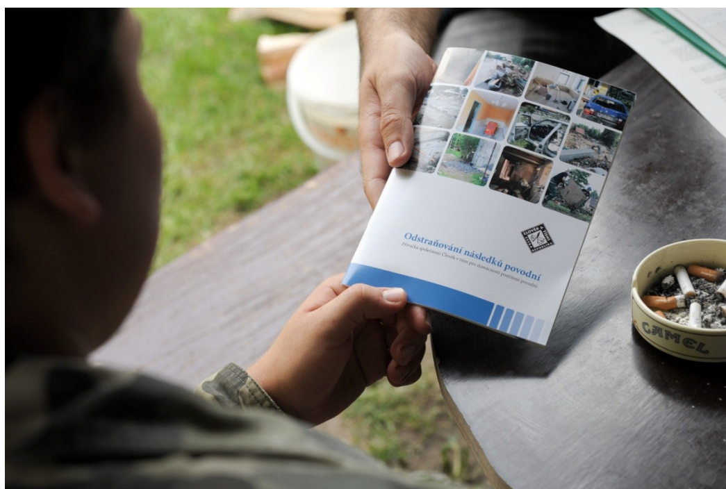
Obrázek 2: Metodika Odstraňování následků povodní Člověka v tísni

Tato pomoc je ve většině případů formou finančních příspěvků. Vzhledem k tomu, že povodně 2013 v ČR jsou již šesté v řadě, při kterých pomáháme, disponuje Člověk v tísni značným množstvím zkušeností, které jsou zapracovány do metodiky, a umožňují organizaci rychleji a efektivněji pracovat.