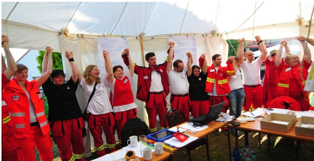
Obrázek 3: Členové HJ ČČK na ranním koordinačním setkání OS ČČK Mělník

působností, který pracuje na principu vzájemné výpomoci. Na místě povodňové události se tak můžete setkat s členy HJ ČČK z jiného kraje, jak tomu bylo například při povodních na Mělnicku v roce 2013, kde bylo nasazeno celkem osm HJ ČČK různých OS ČČK (obrázek č. 3).