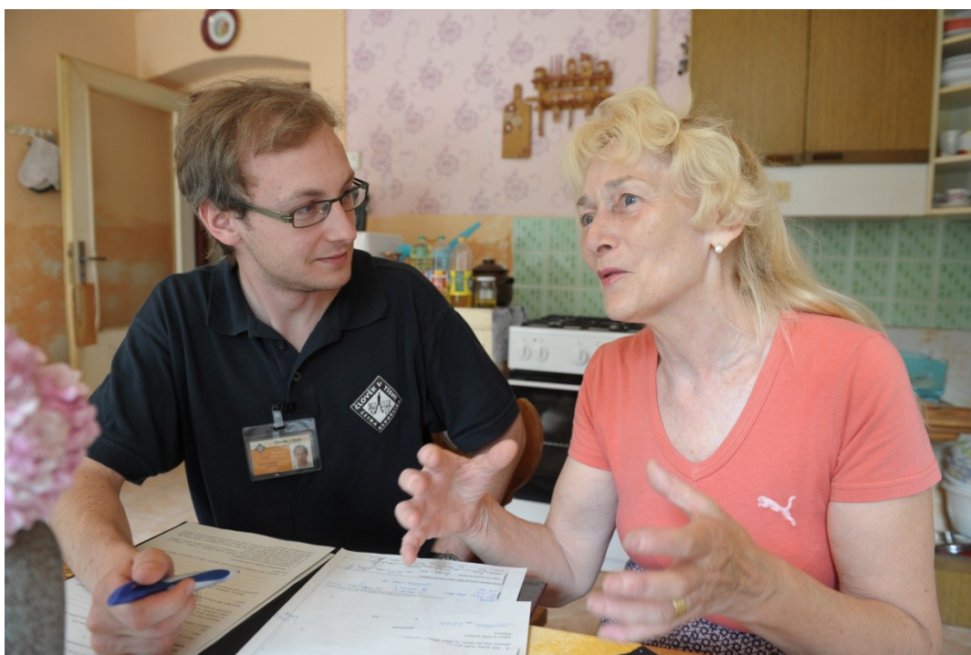
Obrázek 4: Práce terénních pracovníků v rodinách

Finanční pomoc patří k hlavním aktivitám Člověka v tísni při povodních. Pomoc poskytuje postiženým rodinám a jednotlivcům, ale také podporuje obnovu objektů veřejného zájmu. Terénní pracovníci se snaží navštívit každého postiženého, přičemž v případě nezastižení zanechávají vzkaz s kontaktními informacemi. Základem pomoci je dobrá a pečlivá práce terénního pracovníka, který na místě zjišťuje míru poškození a detailní socioekonomickou situaci rodiny. Na základě zjištěných informací následně připravuje podklady pro rozhodování včetně návrhu výše příspěvku s jeho odůvodněním.