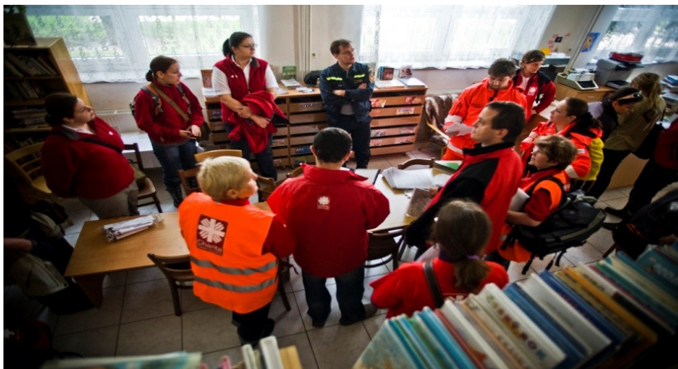
Obrázek 1: Schůzka zástupců NNO před zahájením monitoringu v Troubkách 2010

Diakonie ČCE ve skladu materiální pomoci ČČK při povodních na Mělnicku v roce 2013 (obrázek č. 2), vznik „Ad hoc“ PANELů při povodních v Libereckém kraji v roce 2010.