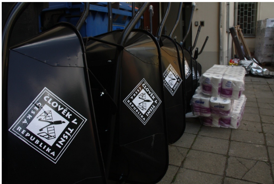
Obrázek 3: Materiální pomoc Člověka v tísni při povodních

Vzhledem k velkému personálnímu a finančnímu zázemí organizace je Člověk v tísni schopen v první etapě zasahovat velmi rychle. První distribuce materiální pomoci v roce 2013 proběhla již 4. 6., tedy třetí den povodní.