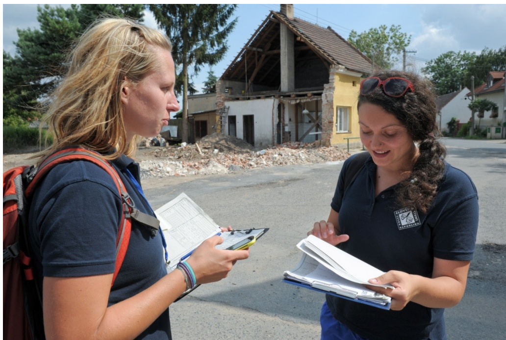
Obrázek 5: Dobrovolníci Člověka v tísni při povodních