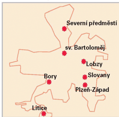
Farní charity v Plzni