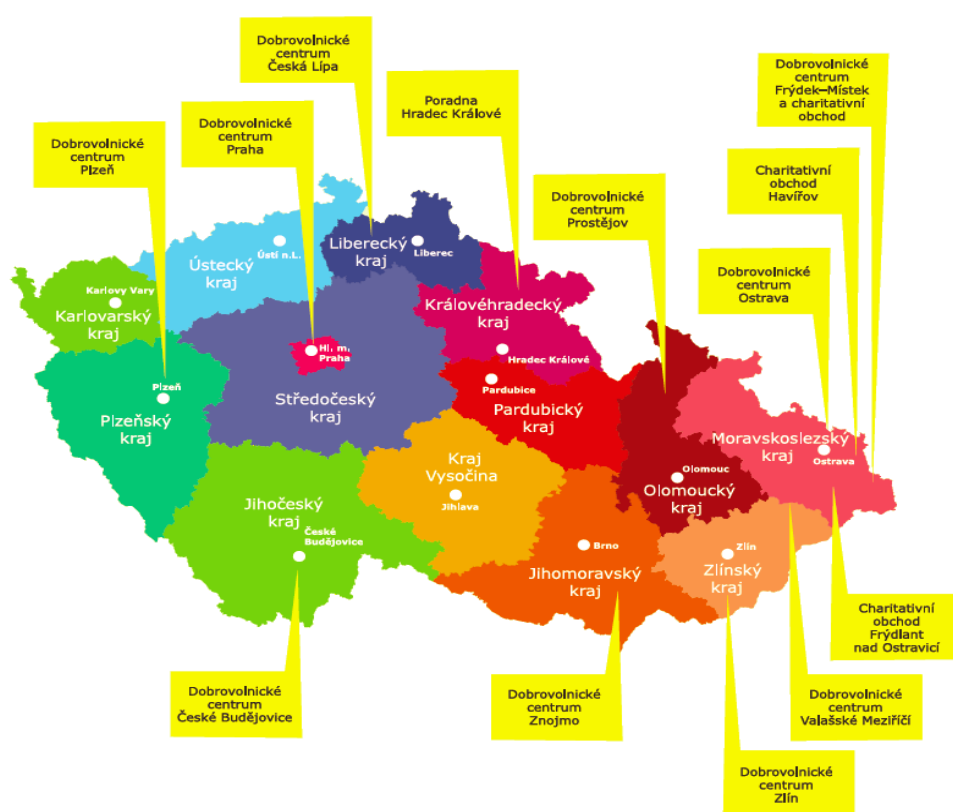
Obrázek 1: Dobrovolnická centra ADRA v ČR