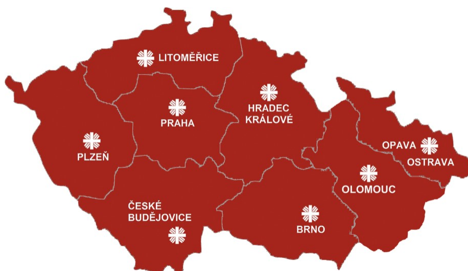
Obrázek 1: Správní celky římskokatolické církve v ČR

Struktura Charity kopíruje uspořádání římskokatolické církve v České republice, které se liší od územně správního členění České republiky. Na rozdíl od 14 vyšších územně správních celků je církevně území České republiky rozděleno do 8 správních jednotek – 2 arcidiecézí (pražská a olomoucká) a 6 diecézí (litoměřická, plzeňská, českobudějovická, brněnská a ostravsko-opavská). Od jejich názvu se odvozují názvy arcidiecézních a diecézních Charit, kterých je tedy též 8 a jejich působnost je omezena hranicemi církevně správních jednotek. Tyto Charity mají vlastní právní subjektivitu a v rámci státního členění jsou partnery těch krajů, na jejichž území zasahují. Působnost např. Arcidiecézní charity Olomouc je v Olomouckém, Zlínském a z malé části v Pardubickém a Jihomoravském kraji.