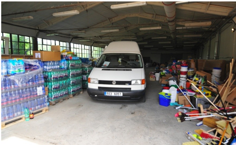
Obrázek 4: Sklad materiální pomoci OS ČČK Mělník při povodních v roce 2013

Na Mělnicku při povodni 2013 místní OS ČČK zřizoval sklad materiální pomoci zásobující celkem 36 obcí. Denně se na chodu skladu podílelo přes 10 dobrovolníků, členů ČČK (obrázek č. 4), dopravu zajišťovali místní dopravci nebo zasažené obce pověřili jednoho zástupce (často jednotku sboru dobrovolných hasičů) a materiální pomoc byla dopravována z místního skladu ČČK do skladu v každé obci.