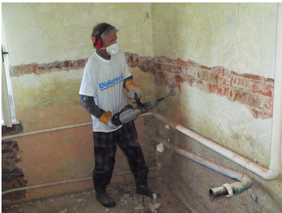
Obrázek 2: Druhá etapa pomoci, období likvidačních prací