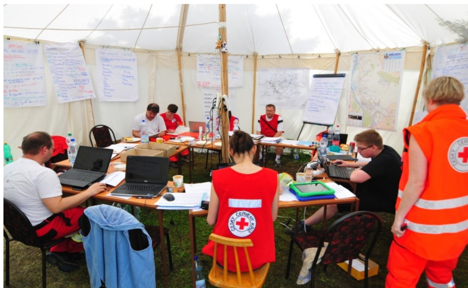
Obrázek 5: Koordinační štáb OS ČČK Mělník při povodních v roce 2013

V místním skladu ČČK byla vedena evidence materiální pomoci v elektronické podobě a bylo tak možné sdílet aktuální údaje s vedením ČČK, příslušníky HZS, zástupci samosprávy (obrázek č. 5).