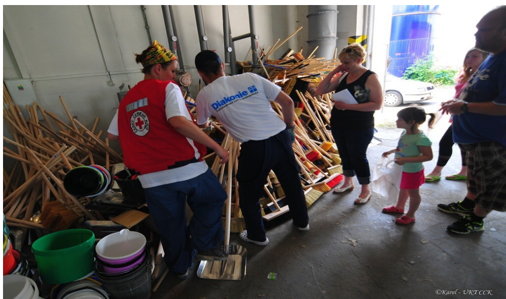
Obrázek 2: Práce dobrovolníků ČČK a Diakonie ČCE v skladu materiální pomoci OS ČČK Mělník