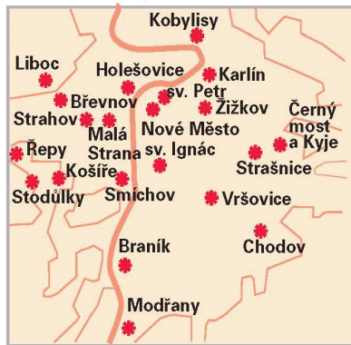
Farní charity v Praze