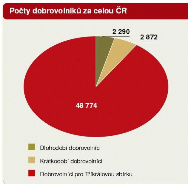
Obrázek 4: Dobrovolníci Charity ČR