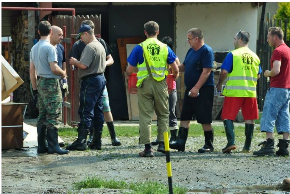
Obrázek 4: Dobrovolníci při povodních 2013

pojištění může vztahovat ke způsobené škodě dobrovolníkem v průběhu výkonu jeho dobrovolnické činnosti 8 .