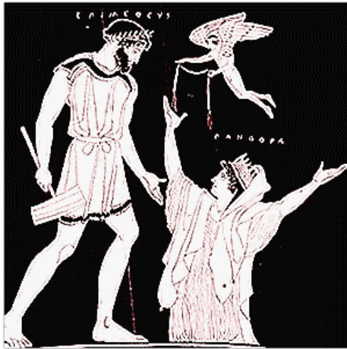
T22.1 Epimetheus, the birth of Pandora, Eros