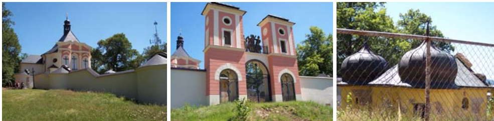
Obr. 2.9: Poutní místo Kalvárie u Jevíčka

Význam objektů historického kulturního dědictví se zvyšuje spolu s návštěvností, která má vzrůstající tendenci.