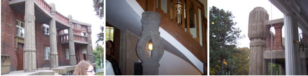
Obr. 2.7: Praha, vila sochaře Bílka