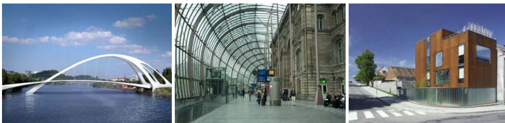
Obr. 2.4: Architektonické řešení novostaveb je jistě novou kulturní hodnotou (zleva: návrh nového mostu v Praze; Strassburg nádraží; dům v Humpolci od arch. Rýznera)

Mezi kulturní hodnoty patří také schopnost vytvářet kulturní prostředí a nové hodnoty.