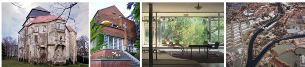
Obr. 2.1: Ochrana památek zahrnuje péči o objekty a lokality z různých časových období (zleva: zámek v Miroslavi; vila z období 1922-24; vila Tugendhat v Brně; urbanistická struktura Hradce Králové)

Výukový cyklus je zaměřen zejména na tematiku architektonického a urbanistického kulturního dědictví, jako základu kulturních hodnot v území. Vyplývá to z oborového zaměření studentů a z nutnosti zúžení velmi obecné problematiky kulturních hodnot.