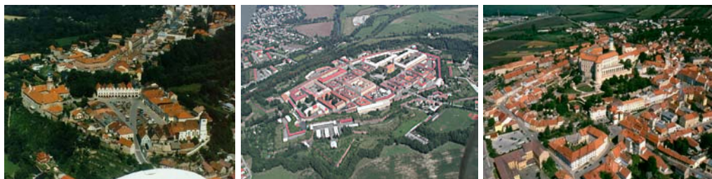
Obr. 2.3: Ukázky MPR v ČR (zleva: Nové město nad Metují; Josefov; Mikulov)

Kromě sídelních – městských a vesnických památkových zón (MPZ, VPZ) jsou vyhlášovány i krajinné památkové zóny (KPZ), chránící rozsáhlejší úseky kulturní krajiny.