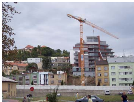
Obr. 2.5: Výstavba nového bytového domu Anenské terasy v Brně zakrývá zcela pohled na historickou dominantu Petrova.

Obdobně jsou historické objekty a skupiny objektů zastoupeny v krajině a ve venkovském prostoru. Zde jsou přirozenou součástí krajinné kompozice, tvoří dominanty, významné komponenty krajinného rázu, orientační body. Krajinný ráz je třeba zachovat, citlivě dotvářet.