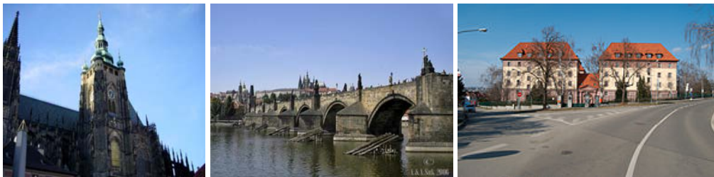
Obr.2.2: Příklady NKP (zleva: katedrála Sv. Víta v Praze; Karlův mos; Kounicovy koleje v Brně)

Národní kulturní památky (NKP) , které tvoří nejvýznamnější součást kulturního dědictví národa, prohlašuje vláda ČR.