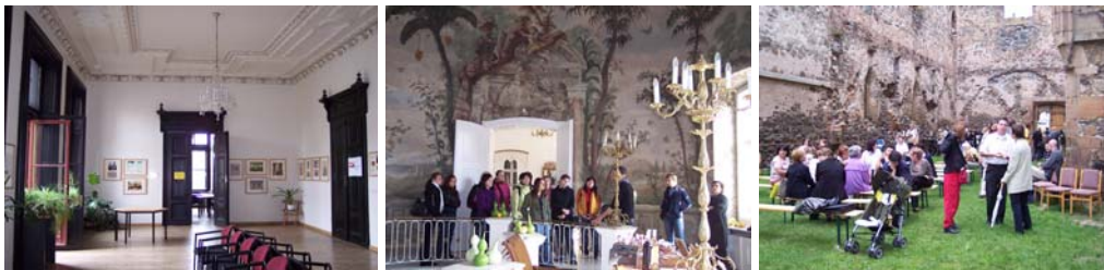
Obr. 2.8: Brno, Berglerova vila; letohrádek Mitrovských; Rosa Coeli Dolní Kounice