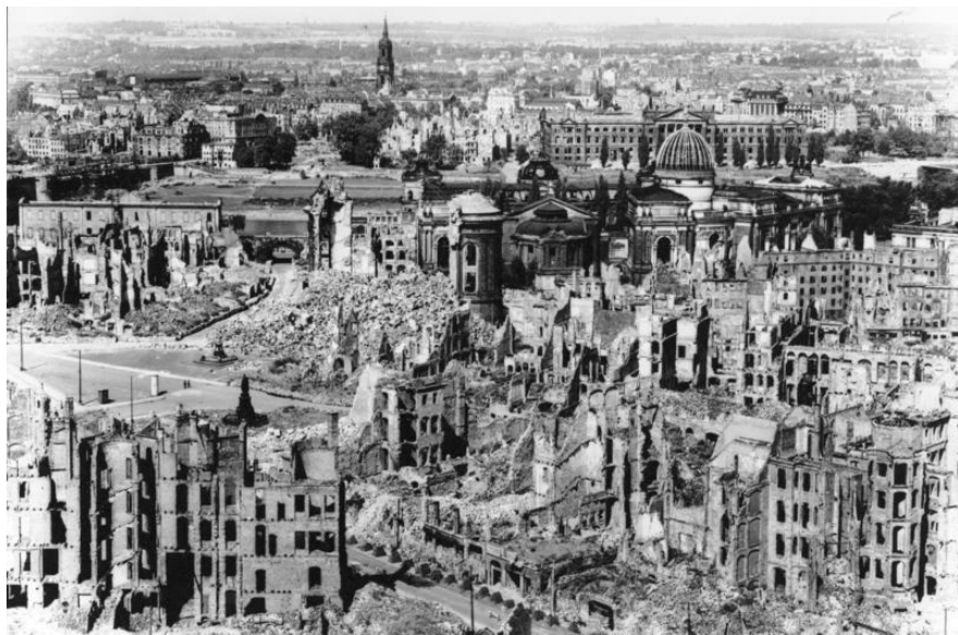
Centrum Drážďan po bombardování v roce 1945