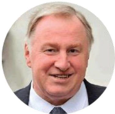
Karl-Heinz Lambertz, předseda