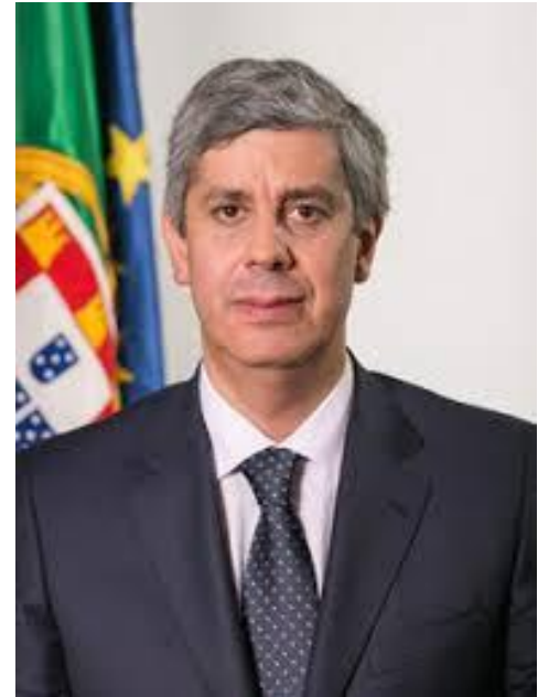
předseda Euroskupiny Mário Centeno