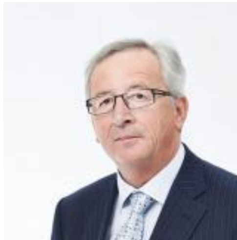
předseda EK Jean-Claude Juncker