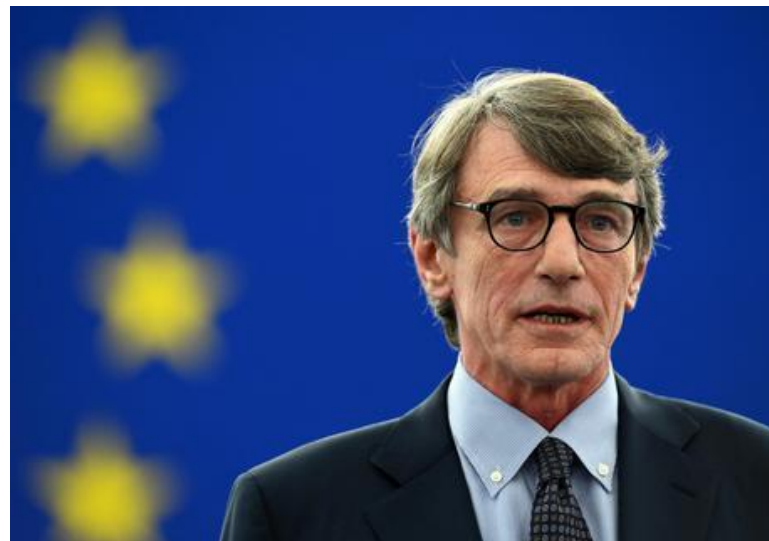
Předseda EP David Sassoli