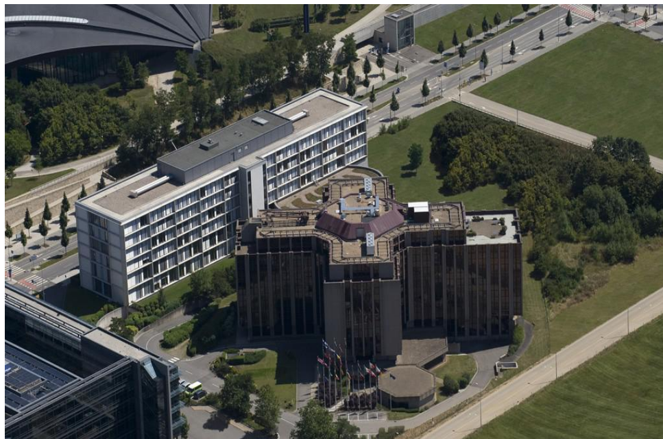
Evropský účetní dvůr