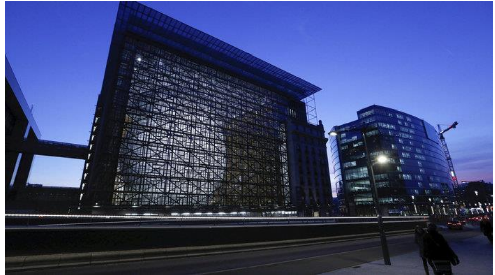
Budova Evropa, Brusel