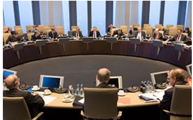
Zasedání Evropské centrální banky