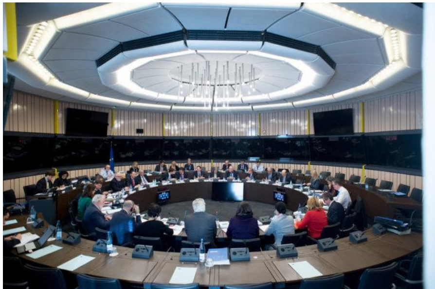
Zasedání Evropské komise