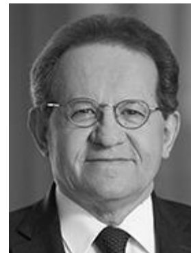
Vítor Constâncio, víceprezident ECB