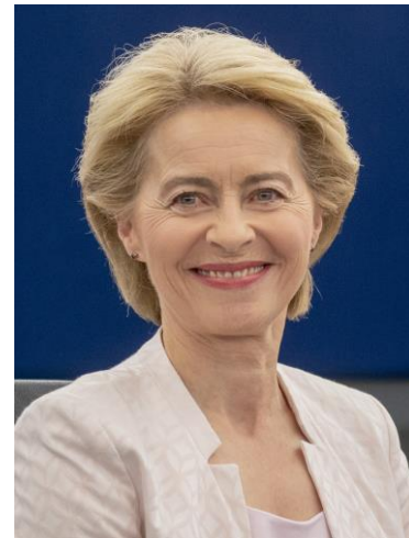
Předsedkyně EK Ursula von der Leyen