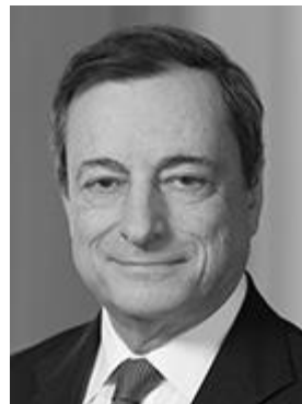
Mario Draghi, prezident ECB