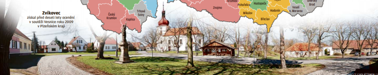
© JIŘÍ VEJNÍK / PPR // KOLÁŽ SIMON / LNA

Zvíkovec získal před deseti lety ocenění v soutěži Vesnice roku 2009 v Plzeňském kraji