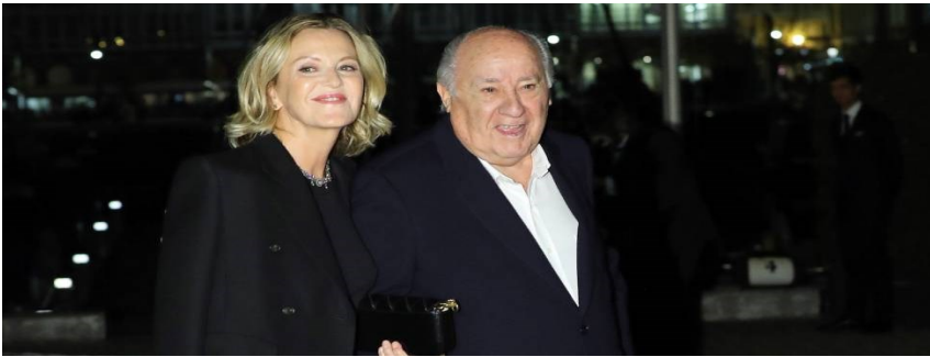
Amancio Ortega junto a su