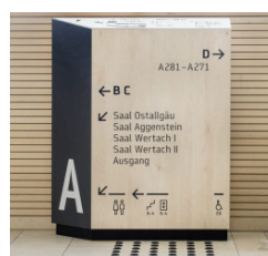
viz. informační tabule