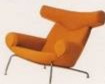
Hans J. Wegner 1961