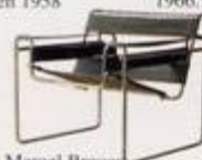
Marcel Breuer 1925