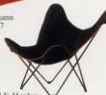
J.F. Hardoy, A. Bonet & J. Kurchen 1938