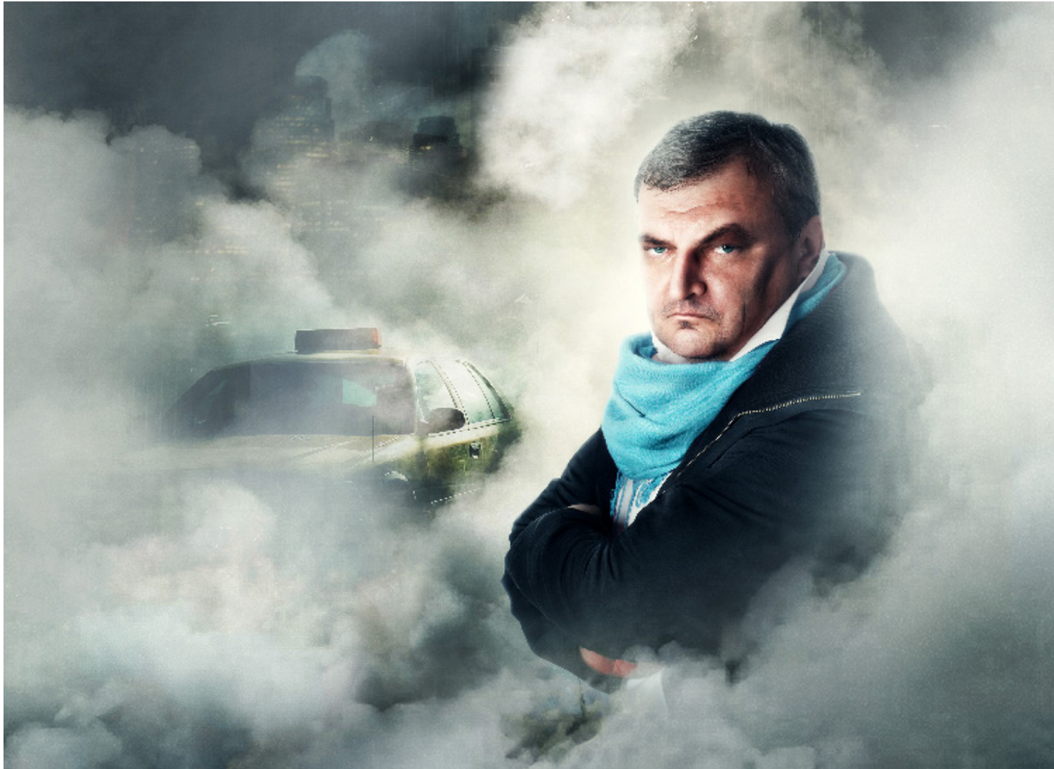
fotomontáž, Adam Hrubý