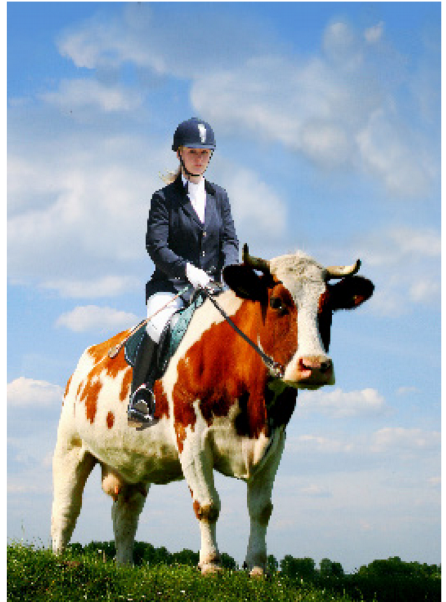
Fotomanipulace, Ondřej Frinta 11