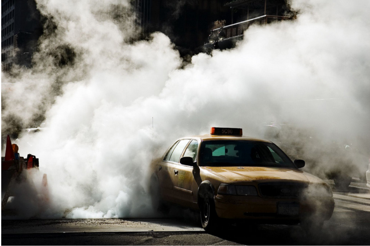
Fotomanipulace, Adam Hrubý